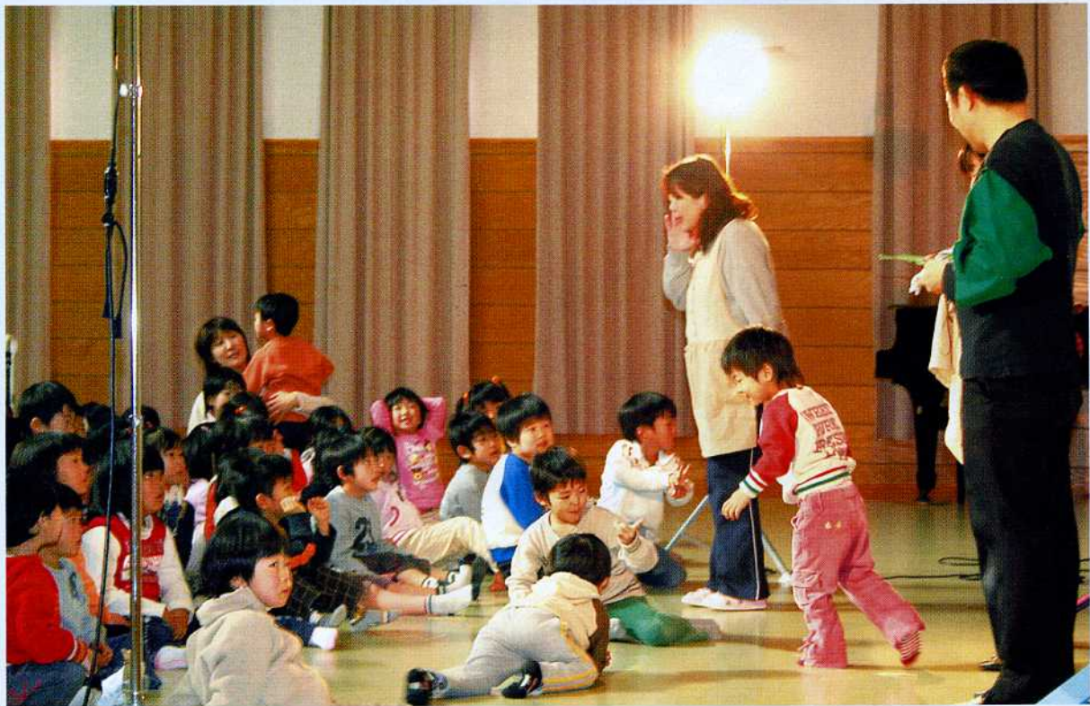
影絵劇を楽しむ子どもたち (みかも保育所)