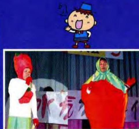
手作り衣装・いちごちゃん