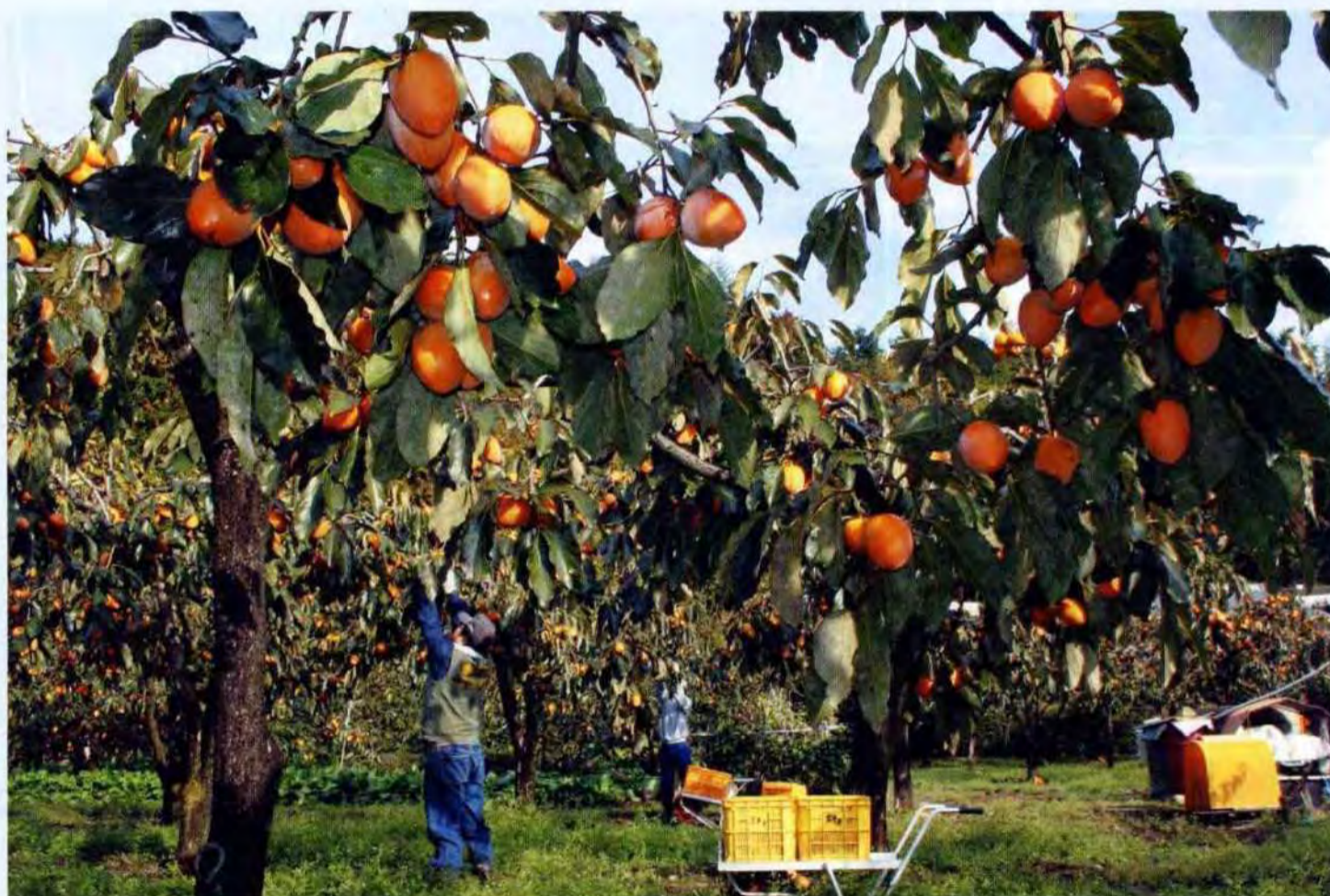
愛宕柿の収穫が最盛期を迎えました