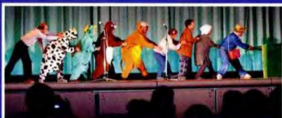
手話サークル「大きなかぶ」 町長も出演しました