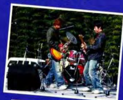
アマチュアバンド