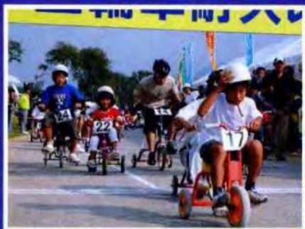
白熱した三輪車1時間耐久レース