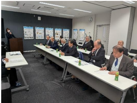
▲施設概要の説明を受ける東みよし町議会議員のみなさま

限られた時間ではございましたが、し尿処理施設の業務の理解を深めていただく貴重な機会となりました。引き続きより良い施設運営に努めてまいります。