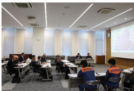
▲伊賀地域消防指令センター