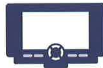
ポータブルカーナビ