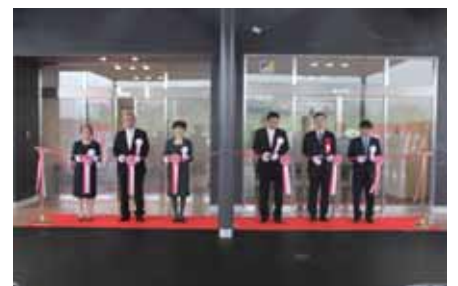
▲落成式テープカット