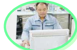
ビルメンテナンス会社