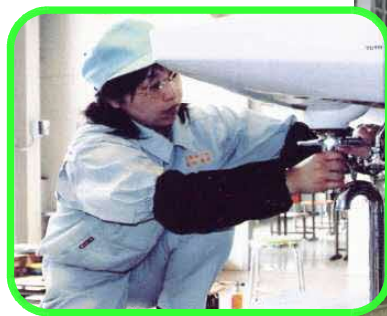
衛生設備の取付け