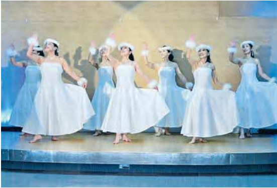
フラウアナ (現代フラ) FUNフラパーティーにて