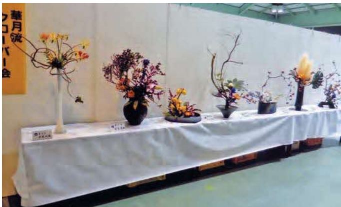
華月流クローバー会