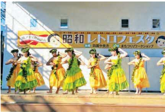
川之江商店街イベントにて