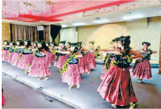
フラカヒコ (古典フラ) FUNフラパーティーにて