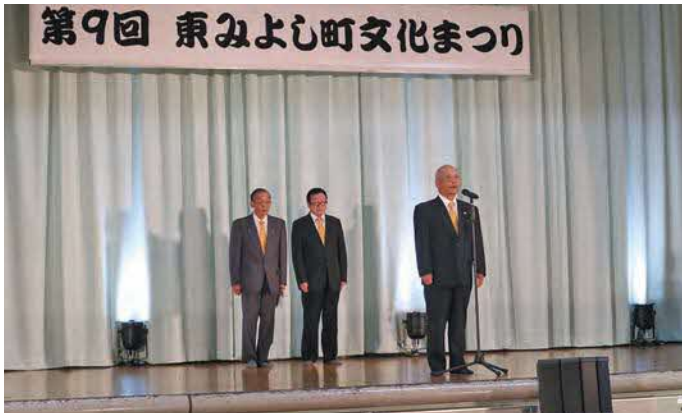
岳勝会吟友支部 三加茂教室