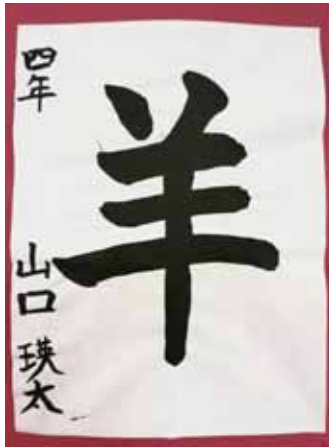
4年 やまぐち 瑛太 山口