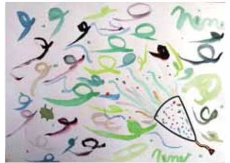
3年 やました ねね 山下 寧々