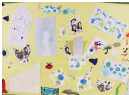
4年 たむら まりん 田村 菜鈴