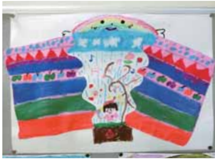
2年 たなか こはる 田中 心遥