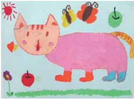
1年 さえぐさ 莉乃 三枝