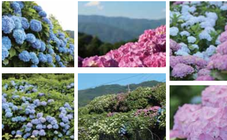
▲左から、フラワーロード、桑内(民宿安藤近く)、絵堂公民館