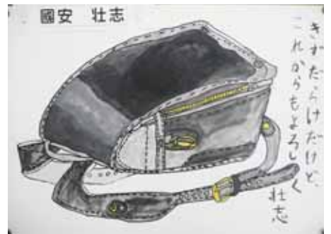
6年 くによす そうし 國安 壮志