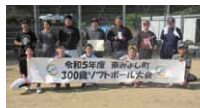
準優勝 11区ライオンズチーム