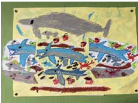
2年 たまき あやと 玉木 文登