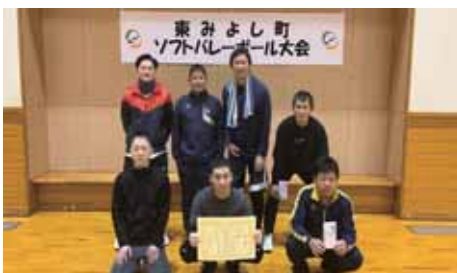
優勝 1区 NEXUS

ふれアリーナみよしで令和5年度東みよし町ソフトバレーボール大会が開催されました。結果は次のとおりです。