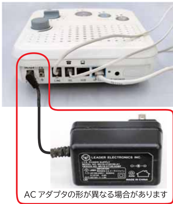
ACアダプタの形が異なる場合があります

サービス終了後は、音声告知端末機の電源を抜いてください。ランプが点滅する機種もあります。