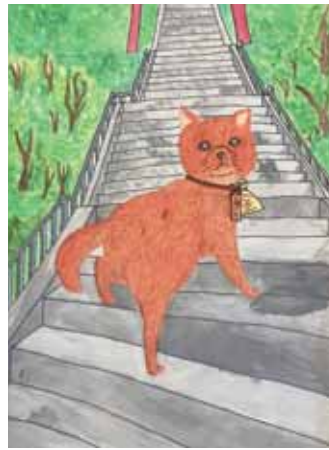
5年 白川 畔 しろがわ ほとり