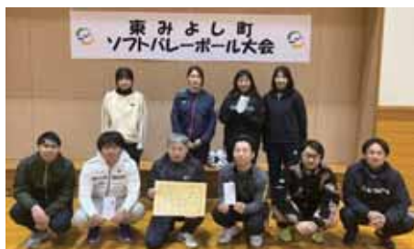
準優勝 12区 がんばるマン