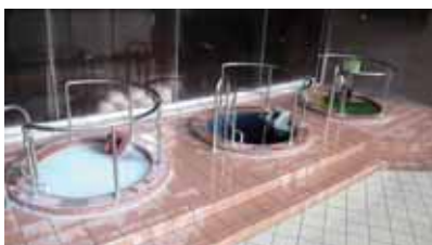
▲色鮮やかな立ち湯はとても良い香り

今回新設される屋内遊具は、天候関係なくお出かけできるのでとても良いですね。特集してみても、遊び場から飲食店、お風呂まで完備された複合施設の魅力に改めて気付きました。特に美濃田の湯は、幼い頃よく訪れていたので懐かしい気持ちでの撮影となりました。これからの季節、夜も寒すぎず温泉を楽しめそうですね。露天風呂はどちらも吉野川沿いの屋外にあるので、川の音や鳥の音が良く聞こえておすすめです。近くだと、美濃田の淵でのお花見も綺麗です。ぜひ訪れてみてください。