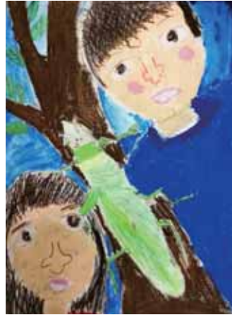
2年 大久保 旭 おおくほ あさひ