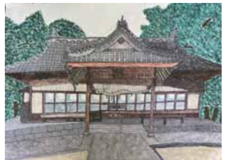
6年 三木 快流 みき かいりゅう