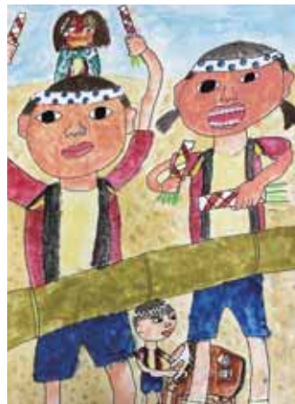
3年 西尾 航太郎 にしお かつら