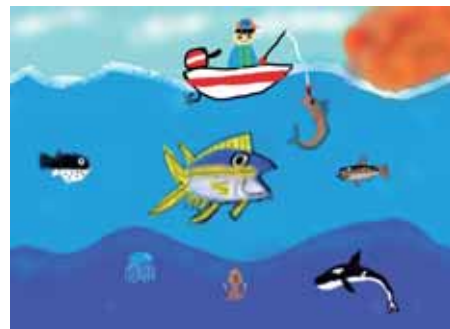
4年 赤松 壮泰 あかまつ そうた