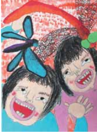
1年 高橋 月華 たかはし かづは