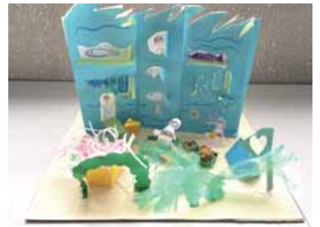
2年 宮本 奈都 みやもと なつ