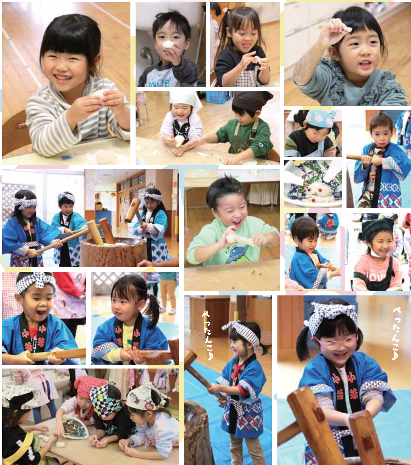
みかも保育所 餅つき・正月飾り作り (20P 今月のひとこと)