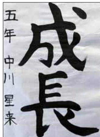
5年 中川 星来 なかがわ せいらい