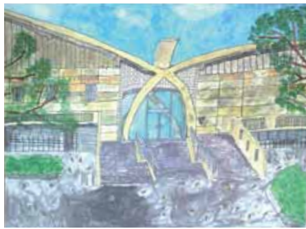
5年 細川 夏偉俐 ほそかわ かいり