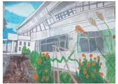
6年 曾我部 彩乃 そがべ あやの