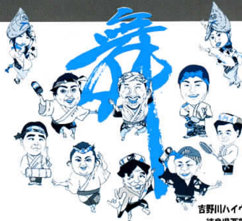
東みよし町 吉野川ハイウェイオアシス 徳島県西部阿波踊り協会

お問い合わせ先 吉野川ハイウェイオアシス(☎79-5858) 東みよし町商工観光課(☎79-5345)