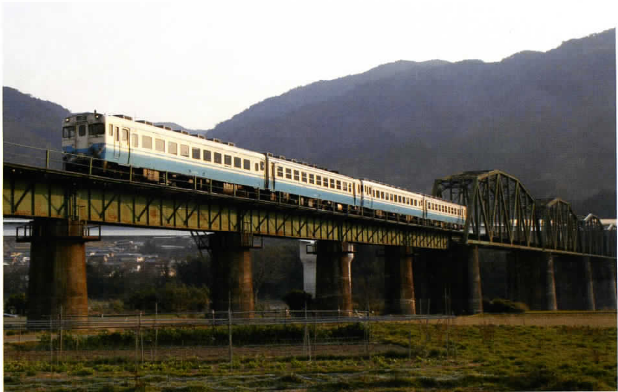
東みよし町吉野川橋梁を走るキハ58 (16Pに関連記事)