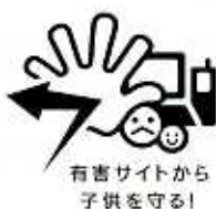
上のロゴは、社団法人電気通信事業者協会より許可をいただき使用しています。

◇「学校裏サイト」 子どもたちによってつくられた学校内の情報交換を目的としたサイトで、誹謗中傷に発展して問題になっています。