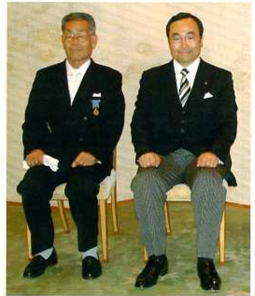
伝達者の飯泉県知事との記念撮影