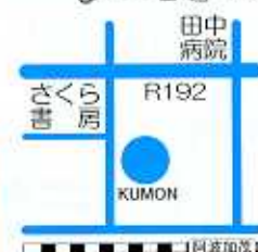
さくら書房 田中病院 R192 KUMON