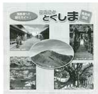
▲「移住ガイド」パンフレット