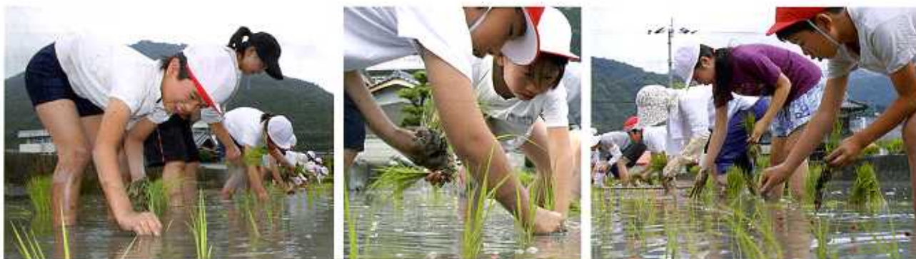
三庄小学校5年生による古代米の田植え