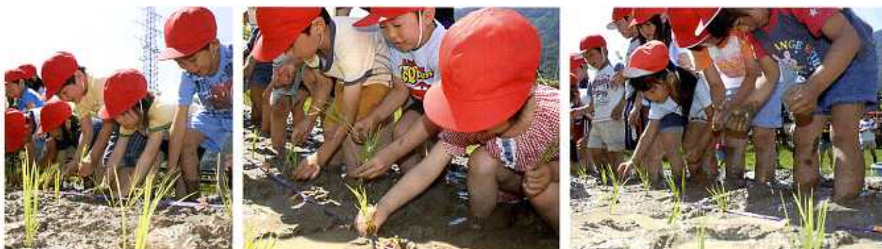
足代・昼間・東山幼稚園児による吉野川ハイウェイオアシスでの田植え