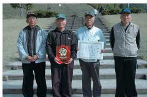
▲町体協三好支部パークゴルフ優勝 第10区