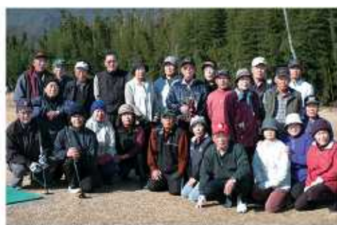
▲支部対抗町長杯パークゴルフ優勝 三庄支部

最後に子どもたちがお待ちかねのサンタクロースが登場し、頑張ったご褒美として一人ひとりにプレゼントが手渡されました。