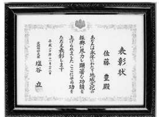
▲授与された表彰状