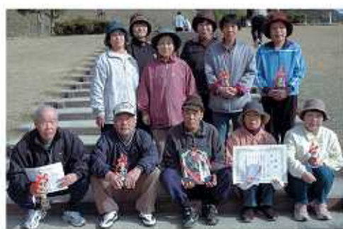
▲町体協三好支部グラウンド・ゴルフ優勝 第14区