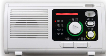
高さ10cm 横20cm 重さ500g

令和5年4月からの防災情報やお知らせは、住民の皆様がお持ちのスマートフォンアプリや携帯電話のメールで受信してください。