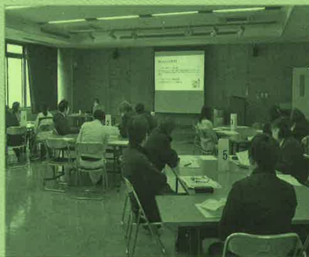
認知症サポーター養成講座