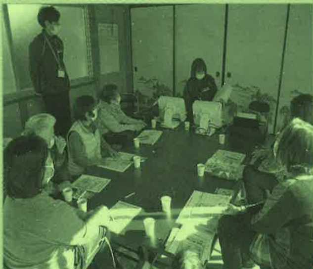
地域のサロンで出張講座