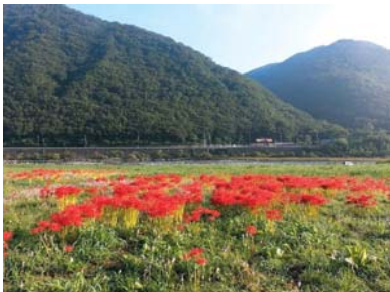
▲吉野川の河川敷に群生する彼岸花(加茂・原)