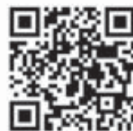
年金ポータルホームページ

年金について知りたいことがすぐ探せる「わたしとみんなの年金ポータル」というサイトがあります。年金ポータルを通じて自分の知りたい年金情報に簡単にアクセスできます。詳しくは、「年金ポータル」で検索していただくか、下記URLまたは二次元コードより「年金ポータル」のホームページへアクセスしてください。