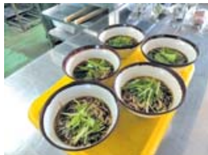
▲セミナーで出されたヴィーガン対応ラーメン