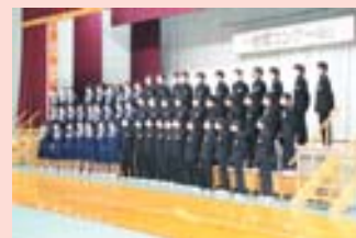
3年生全員合唱「時を越えて」

11月5日、2年ぶりに合唱コンクールを行いました。マスクを着けているとは思えないほど元気な澄み渡った声が響きました。オープンスクールとして午前中のリハーサルを公開しました。