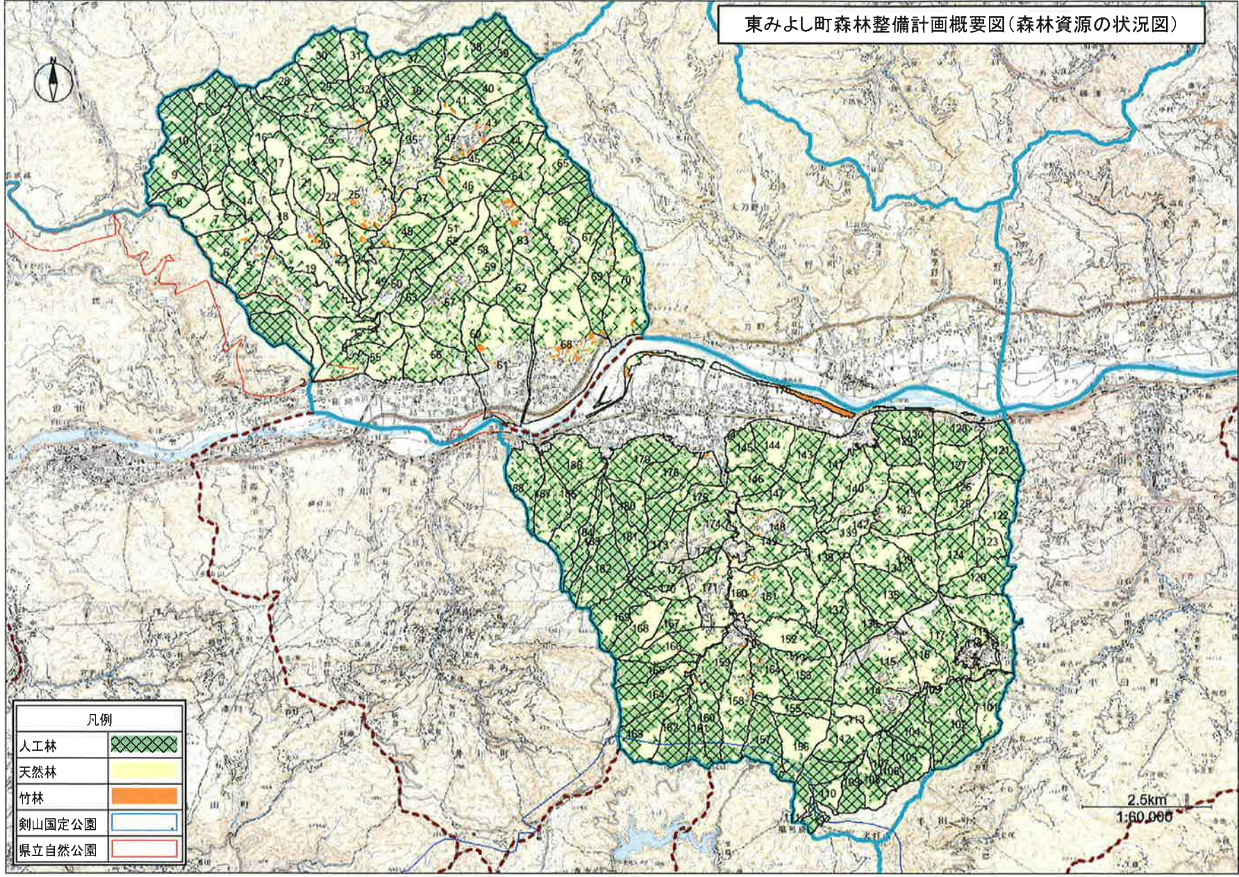
東みよし町森林整備計画概要図(森林資源の状況図)