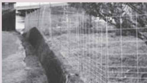
畑に設置されているメッシュ柵

4月以降、泉野・加茂山・法市・畑・昼間地域ではサルやイノシシ、一部鹿による農作物への被害が多発している。地域の住民から鳥獣被害対策の要望があり、