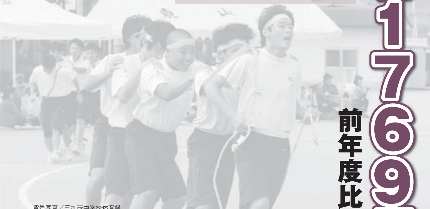
背景写真／三加茂中学校体育祭