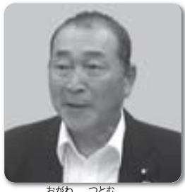
おがわ つとむ 議員 小川 勉