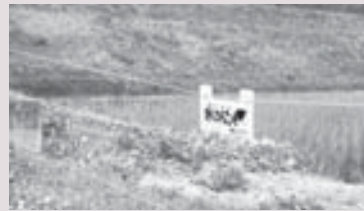
電気柵の設置に補助

職員である限り、本町での災害対応に当たるべきであり、職員自身もそういう認識であると考えている。