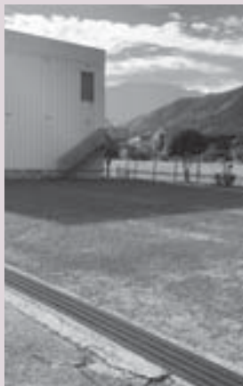
改修される加茂公民館駐車場