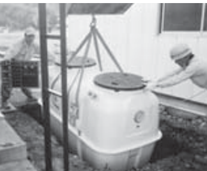
設置工事の合併浄化槽

債務負担行為とは、ひとつの事業が単年度で終了せずに、後の年度においても支出負担をしなければならぬ場合に、あらかじめ後の年度の支出負担を約束することを