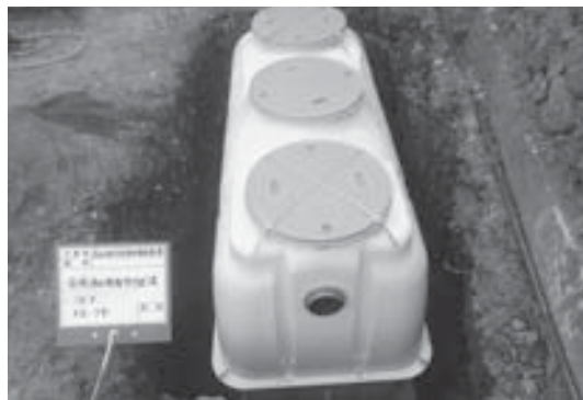
設置された合併浄化槽