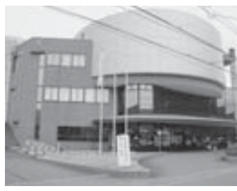
増築が予定されている三加茂庁舎

三加茂庁舎の東側には加茂谷川が流れており、土石流等によりせき止められ氾濫すれば三加茂庁舎は避難所として利用できない。もつと災害に強い庁舎を作るべきだ。