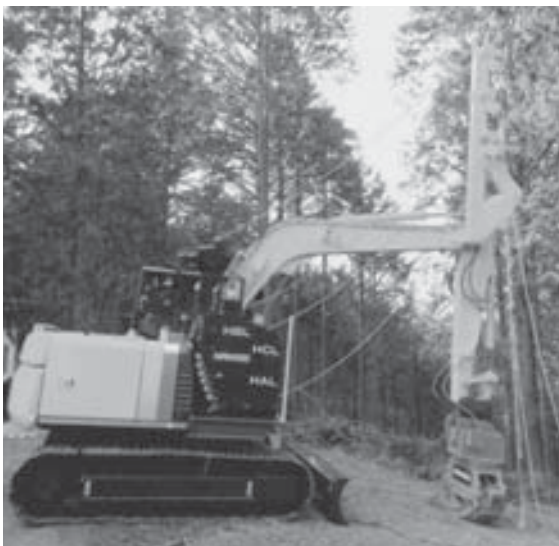
スイングヤーダ（イメージ写真）

この重機は、不整地・傾斜地でパワフル&スピーディな集材作業を行い、専用台座を装備し、集材用ウインチが搭載可能。1アタッチメント用油圧配管を標準装備することで、木寄せ・積込・荷降ろし作業も行える。