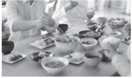
家庭からの食べ物の廃棄が・・・(イメージ写真)

横関 日本の食品ロスは、年間2842万トンのうち、まだ食べられるのに捨てられた廃棄は643万トン。一般家庭では282万トン、大型トラック10トン車1700台が