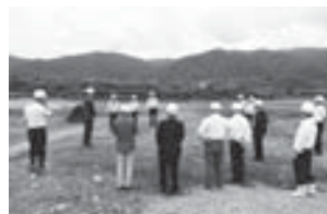
国交省の職員より説明を受ける委員

まず、用地取得状況は、本年8月末現在、全体面積の約92%を取得済みであり、今年度も全体面積の用地取得に向けて交渉を進めているとのこと。工事の実施状況として、今年度、三大橋上流の築堤護岸工事（一部発注済み）、こまた川樋門新設外工事、古川樋門新設工事及び支線である加茂谷川築堤護岸工事を実施することのこと。築堤工事完了後のこまた川の整備についても、管理等を含めた協議を重ねて、今後実施していきたい