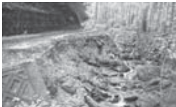
路肩が崩落した町道本在所線

建設課長 8月13日〜16日に襲来した台風10号の大雨の影響により、三加茂地区毛田の町道本在所線の谷沿いの路肩（毛田小学校から南へ1キロの場所）が2か所崩落した。通行の安全確保をするため、コンクリートブロック積工で、延長6.5m、幅3.5m、もう1か所は延長11m、幅3.3mの復旧工事を行う。工事費800万円。