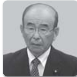
よしい たけし 議員 吉井 武

吉井 日本の農業は、食料・農業・農村基本計画を基に、地域の農業振興施策及び方向性が求められている。農地の有効利用を図るため、農地の集積、集約化に取り組み、持続可能な農業を実現することが必要だ。地域の農業活性化を図るため、人・農地プランの作成が必要となる。その作成についてどの様に考えているのか。