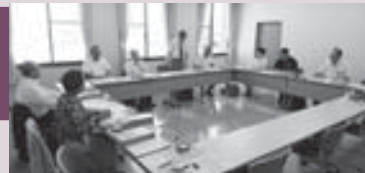
北栄町広報委員会研修