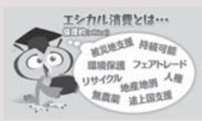
エシカル消費とは？