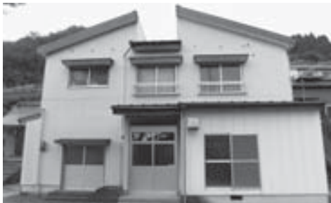
五名生活改善センター

委員 どのくらい距離の給水管の改修をするのか。 産業課長 三加茂地区の山間部に位置する五名生活改善センターは、地域の交流の場として昭和55年に建設されてから39年が経つ。センターに水を供給するために、谷あいの上流から水を引き、台所やトイレなどの水を賄っている。しかし、給水パイプが老朽化し、漏水などでも思うような水量が確保できなくなった。今回、全長110mの給水管引替工事を行う。工事費35万円。