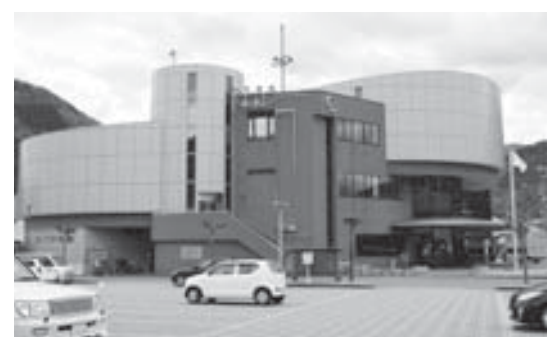
増築が予定されている三加茂庁舎

場所へ庁舎を増築するのはいかげなものかと思う。増築には合併特別債を充て、有効期限は平成32年度を期限として事業を実施することだ