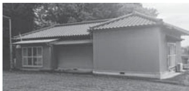
トイレの改修が待たれる宮ノ岡集会所

足代地域の中の間集会所及び、宮ノ岡集会所（共に昭和55年建築・平成8年増改築）は、汲み取り式和式トイレである。今回、足腰が弱い高齢利