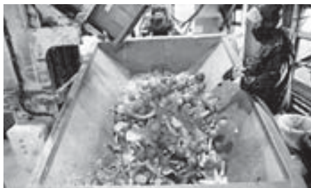
大量の食品の廃棄 (イメージ写真)

食品ロス削減に向けての町独自の計画策定はしていない。今後とも食品ロスなどについての普及啓発に取り組みたい。