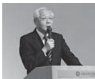
講演する田崎史郎氏