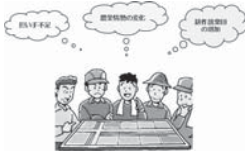
地域農業の話し合いを(イメージ図)

農業経営改善計画認定申請書を提出頂き、審査後認定されれば、融資等の支援措置も受ける事が出来る。是非多くの方に申請を頂きたい。そして農業振興の地域の中心経営体として期待したい。