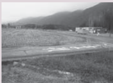
拡張するスポーツセンター線

の用地が取得できていなかった用地300平方メートル、全長約95メートルを購入する。購入費380万円。