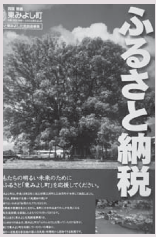
ふるさと納税パンフレット

このようになることを回避するため、商工会に返礼品候補探しを依頼し、既に候補品が報告されているにも関わらず、3ヶ月放置されたままになっている。なぜこのような