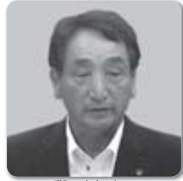
井添 伸一 議員