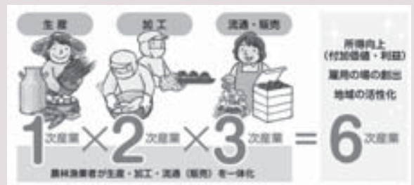
6次産業化のイメージ図

6次産業化の動向も広がっている。先般本町の農産品加工等を行っている施設3カ所の視察をしたが、どの施設も積極的に取り組んでいる。今後高付加価値化による所得向上を図るため、ひいては地域活性化に繋がると思う。町長の公約にある農林畜産業の6次化、ブランド化の推進についての考えは。