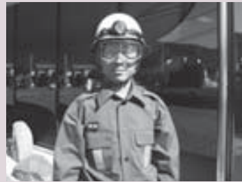
防塵マスクを着用した分団員

委員 消防団へ防塵メガネの個数と、AEDを更新するのはどの分団なのか。 総務課長 消防団の充実を図り、災害現場における消防団員の公務 消防団へ防塵メガネ90個を購入する。「消防団員安全装備品整備事業助成金」を活用し、各分団に配布する。購入費34万9千円。 AED(自動体外式除細動器)は、第3分団の消防車両に搭載されているAEDが使用期限を迎