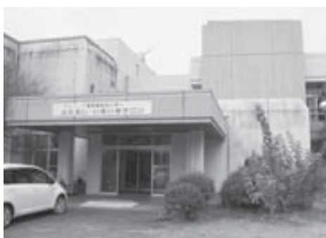
三好東部福祉センター

福祉課長 三好東部福祉センターは、平成14年にモラロジ―研究所より購入し、利用者が年間1万人を超える施設である。経年劣化で2階ベランダ床のコーキングが剥がれ、1階南側の天井より雨漏りが発生している。天井部分の石膏ボードに雨が溜まって