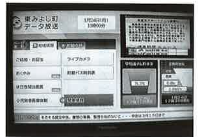
データ放送中のテレビ

りて起点の大師堂に戻る コースになっています。西 町の新四国88カ所につい ては、炭焼大師堂を起点 に88カ所の石仏が西町集 落の里山に安置されてい ると聞いています。西新 四国88カ所については、 文化財には指定されてな いので、文化遺産として の活用は非常に難しいと 思われます。町指定文化 財については、パンフレッ ト、インターネットでの 紹介ができていない現状 であり、今後、観光ガイ ドマップ作製にも参考基 準を作成し、検討してい きたいと思っています。現在 指定されていない歴史 的、文化的な遺産につい ても、地域の方々の活用 への期待もあるかと思 いますので、今後、広報の 歴史民俗資料館のページ を利用して紹介できな いか検討していきます。