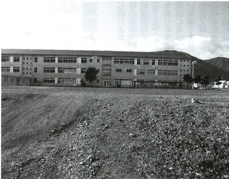
三加茂中学校前の空き地