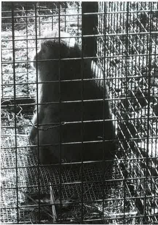
三好市で捕獲されたサル

サル追い払い支援事業の二環で、11月からサルの群れの活動調査を三好市と共同で実施していますが、現在、専用車がなく車を借り上げて調査をしています。しかし、山道の走行が主で、1日の走行距離も長いことから故障が生じやすく、また事故時の対処の危惧等から専用車（軽自動車バン・4輪駆動）を購入入します。