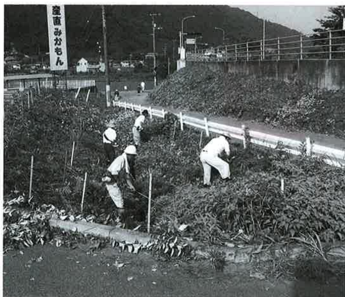
除草ボランティアの活動

体が存在しており、その活動には常々感謝しています。町としても合併後5年を迎えるということ、旧町以来最低5年以上の活動継続に対し、感謝状の贈呈も考えていたところ、昨年は、三三大橋の清掃活動をしている方に対して多方面から質問