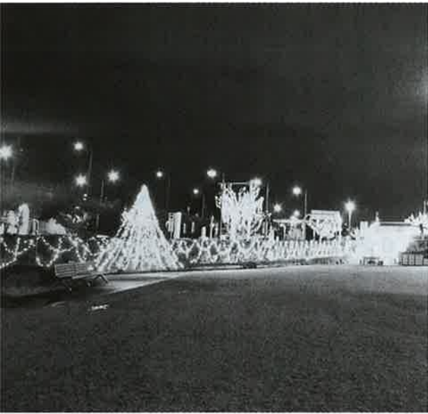
オアシスのイルミネーション

しの場としてLEDイル ミネーションの飾りによ る光の名所計画をもと に、平成18年度より吉 野川オアシス(株)が事業 を開始し、毎年11月30 日から1月31日までの2 か月