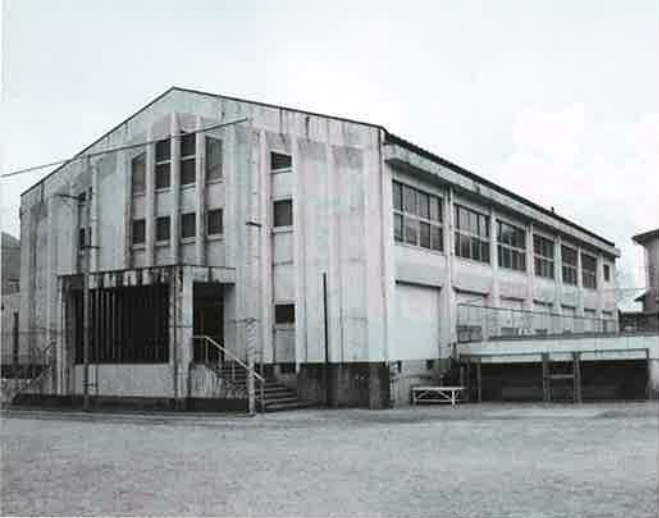
足代小学校体育館

足代小学校の体育館については、耐震補強工事が、改築か。また改築にするなら建設場所をどうするかと議論を重ねていますが、現在の場所に改築をする方向で検討しています。