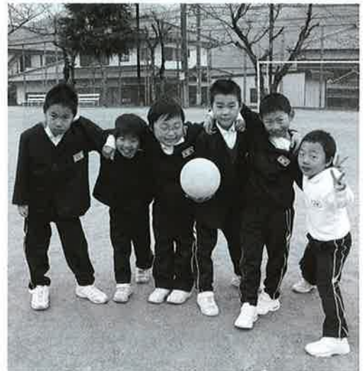
元気な子どもたち

長谷川 現在、県 教育委員会 が小学生の体力の低下 に対して、「子供の運動習 慣確立チャレンジ事業」 として、7月から県内の 小学校5・6年生に歩数 計を貸し出して、歩く運 動に取り組んでいるよう です。11月30日の徳島新 聞にも検証として、徳島 市内では以前より歩くよ うになり、学校に車で送 ってくるのが少なくなった などの紹介がされています 。本町内での取り組み の効果はどうですか。