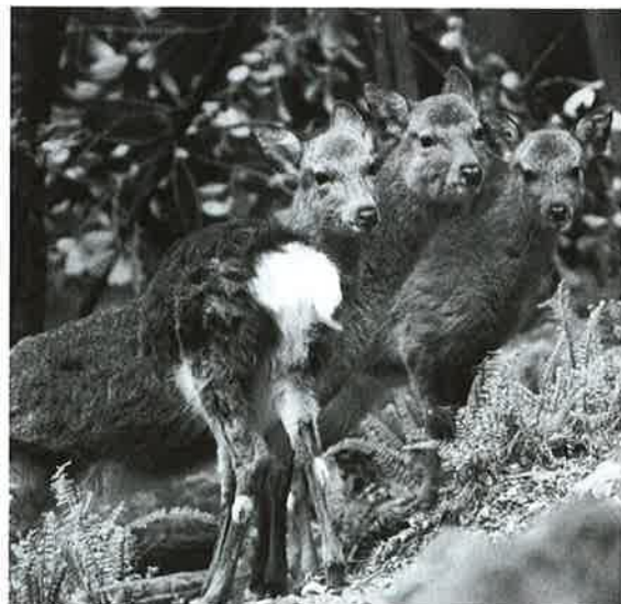
増えるシカの被害