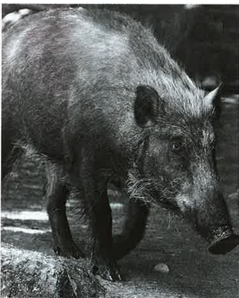
イノシシの被害対策を

㎡、被害金額は1,333万7,000円。サルは3,800㎡、1,18万6,000円。シカは4,000㎡、7万円。平成20年度は、イノシシは3,500㎡、82万9,000円。サルは5,000㎡、94万6,000円。シカは5,000㎡、26万6,000円。平成21年度は、イノシシは800㎡、53万8,000円。サルは1,700㎡、74万円。シカは4,000㎡、5万7,000円。平成22年度は9月末現在、イノシシは6,500㎡、シカは8,000㎡で被害額はまだ出ていません。対策については、電気柵やワイヤー設置の補助や小動物用の箱わなを貸し出し、