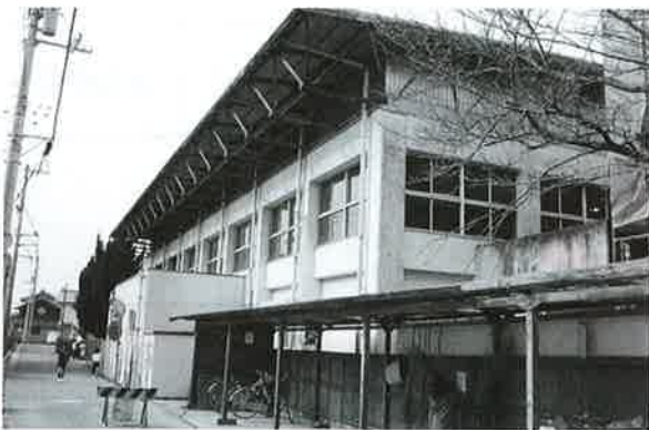
加茂小学校体育館

現在の加茂小学校体育館は昭和50年に建築され、老朽化がかなり進んでいます。35年もの長い間、約2,900人の児童を育み、社会体育の体育館にも活用されてきましたが、建設中の新体育館の完成後、本年3月から解体する予定です。工事費は1,144万8千円。