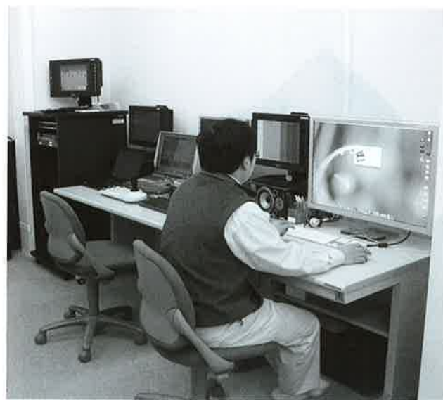
庁舎内にある放送機器

去において同じ議論がさ れ、検討した経緯があり ます。多数の住民からの 要望はなく、現状の放送 になっています。現在も 個人情報になりますの で、同意をいただいた方 のみを新聞、町広報、デー タ放送に載せています が、現時点では、現状の まま、データ放送に喪主 名を載せない方針でござ います。解いただきたいと思 います。なお、住民課への問 い合わせにはお答えして いきたくと思っています。