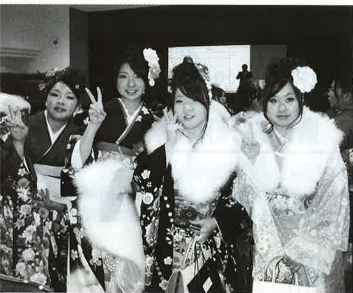
1月4日の成人式にて

健康づくり課長 国の平成22年度の補正予算で、3ワクチンを助成する子宮頸がん等ワクチン接種緊急促進臨時特例交付金が創設されました。子宮頸がんワクチンの対象者が中学校1年生から高校1年生に拡大され、ヒブ、小児用肺炎球菌ワクチンのいずれも対象者は、0歳から4歳児で557名が対象となっています。実施時期は、年明けの1月中に周知し、早急に実施できるように準備を進めているところですが、周知方法は、啓発資料や問診票等を同封した個別通知を考えております。高齢者への肺炎球菌ワクチン助成は、現在考えていません。