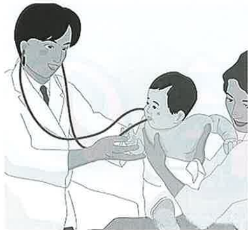
ワクチン接種助成

国は平成22年度補正予算で、市町村が行うワクチンなどの接種費用を支援する「子宮頸がん等ワクチン接種緊急促進臨時特例交付金」を創設しました。接種対象者が無料で接種を受けられるように都道府県で基金を設置し、国と市町村で費用を折半することになりました。対象は子宮頸がん予防（HPV）ワクチンと、細菌性髄膜炎のためのヒブ（イ