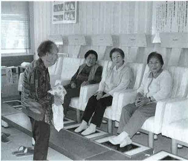
デイサービスセンターでくつろぐお年寄り

正比率は18%以下が望ましいとされているため、今後ますますの努力が望まれる。 将来負担率も早期健全化基準が350%に対して117・6%で、前年度に比べ6・5%減らしてはいるものの100%を超えている。今後、繰上償還など将来負担の軽減を見据えた運営が必要だ。