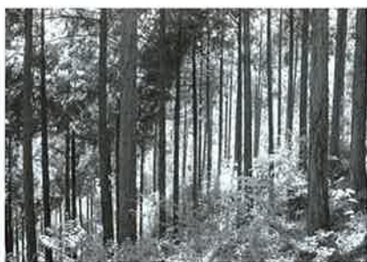
間伐され下層植生の豊かな森林