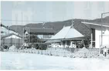
工事中の三庄小学校グラウンドフェンス

三庄小学校のグラウンドを囲んでいるフェンスの一部が老朽化してきたため改修工事を行います。東側(高さ4m 長さ24m)北側(高さ6m 長さ36m)事業費は418万円です。