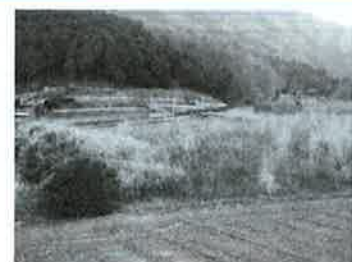
耕作放棄地(再生前)

耕作放棄地を再生・利用する取り組みや、これに付帯する施設等の整備、農地利用調整、営農開始後のフォローアップ等、地域の取り組みを総合的・包括的に支援するための事業です。 平成20年度に町内全域で耕作放棄地の調査を行った結果、農用地区域内における放棄地は71ヶ所にも及ぶ事が分かりました。耕作放棄地は、山間地においては野生鳥獣のすみかになり、平坦部では近隣