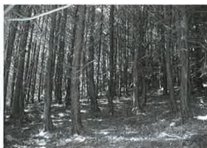
間伐されず荒廃した森林

東みよし町議会では、教育厚生、総務産業建設の2常任委員会を設置しています。本会議から付託された議案を9月11日、15日に開催された各常任委員会で活発に審議をしました。その中の一部を紹介します。