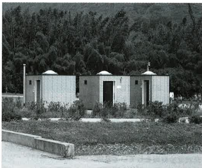
水辺の楽校「ぶぶるパークみかも」のトイレ

水洗トイレは東西に2カ所ある。合併処理浄化槽で計算すると1基千数百万円という金額になる。循環型といった考え方もあるが、国土交通省との協議も必要なので、今後検討していきたい。