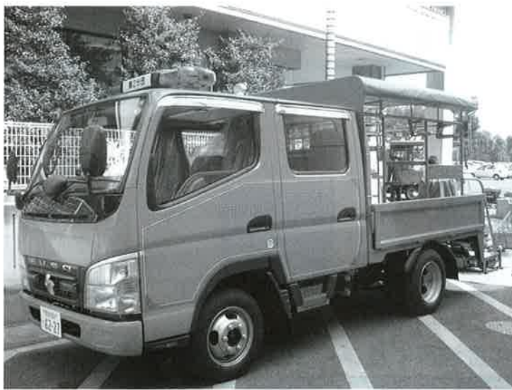
消防ポンプ自動車