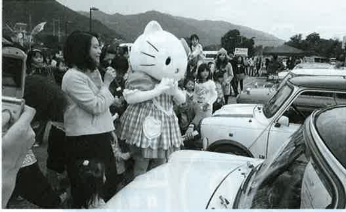
オアシスにやってきたキティちゃん

平成20年度の一般会計および6つの特別会計、1事業会計の歳入歳出決算の審査では、税金や保育料・町営住宅家賃などの滞納金についてのあり方について議員から意見が出されました。