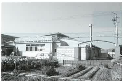
三加茂学校給食センター

かねてから計画していた三好学校給食センターを三加茂学校給食センターに統合するために、三加茂学校給食センターの増築工事を行います。同時に厨房機器の設備工事、カーポートの設置工事を行います。来年の4月からは、幼・小・中学校に同じ給食を提供できるようになります。事業費は5,453万円。国からの交付金2,700万円、有利な借金（合併特例事業債）2,400万円、町からの持ち出し322万円。