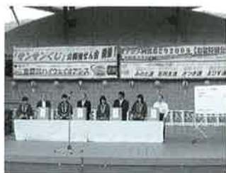
さんさんくじの抽選会

○商品買い上げ1,000円ごとに1枚発行。 ○平成21年12月1日～平成21年12月25日の間。