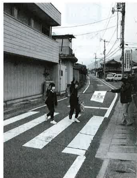
横断歩道を渡る子供たち

議員各位には、飲酒運転ゼロの署名をお願いしている。職員に対しては、1月に道路交通法改正にともなう交通マナーの徹底。5月には、交通死亡事故多発警報による交通指導。6月にも道路交通法改正にともなう交通マナーの徹底をするなど、機会を見て指導をしている。町民に対しては、交通安全週間を通じて、交通安全協会や母の会、三好警察署の協力をいただき、交通安全と交通マナーの啓発を行っていきたい。