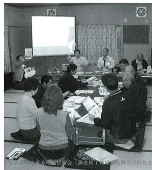
土砂災害危険区域説明会

町内の土砂災害危険箇所は、土石危険渓流が50カ所、地すべり危険箇所が275カ所の合計353カ所ある。平成20年度までに調査と地区説明を終えて区域指定された地区が、土石流危険渓流で11カ所、急傾斜地崩壊危険箇所が18カ所の合計29カ所となっている。全体の土砂災害の危険箇所数の約8%が指定済みとなっている。