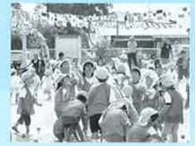
みよし保育所の運動会

建築されてから 22 年が経つみよし保育所。遊戯室と2ヶ所の保育室のエアコンが老朽化して、能力が著しく低下してきました。子ども達が快適に過ごせるように天井式のエアコンを付け替えます。また、衛生環境を整えるために食器洗い機・加湿器・掃除機も設置します。事業費は358万円です。