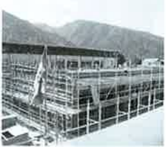
建設中の加茂小学校管理棟

現在、改築中の加茂小学校管理棟の屋根に太陽光発電パネルを設置します。日射計・気温系・液晶ディスプレイ等も同時に設置し、子ども達の環境学習に役立てます。発電量は10kWで、売電までに行きませんが、電気の支出の低減を図ります。事業費は1,232万円です。