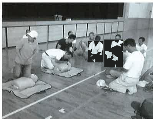
訓練中の自主防災組織

今後、組織数が増えれば、(仮称)東みよし町自主防災連絡会を結成し、県の防災組織連絡会に参加できるように計画をしている。