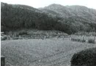
耕作放棄地(再生後)

の迷惑地となります。少子高齢化や後継者・担い手不足などにより今後も耕作放棄地が増加していくと予想され、早急な対策が必要です。今回、国からの交付金300万円を利用して、JA阿波みよしアグリサポートセンターや町内建設業者、担い手等による耕作放棄地再生を行い、さらに耕作放棄地を有効に活用するため、土壌改良や営農再開のサポートも実施していく予定です。