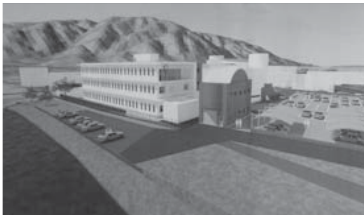
分庁舎イメージ図（北東側より）

第8回庁舎統合建設等特別委員会は、12月14日、午前10時より開催しました。完成した三加茂庁舎分館新築工事の設計について、以前に提示されたものから変更した4点の説明がありました。