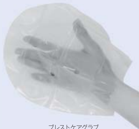
ブレステケアグラブ

60歳〜70歳代が多く発症すると言われていて。セルフチェックの重要性を広報などで告知していただきたい。