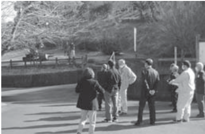
加茂農村公園を視察する委員