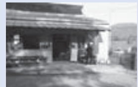
産直みかもの改修される入口前

入口は、コンクリートによつて舗装されているが、経年劣化による傷みが激しく、利用者にとって不便をきたしている。今回、古いコンクリートを除去し、新たに安全と利便性のために67平方メートルのコンクリート舗装工事を行う。工事費64万9000円。