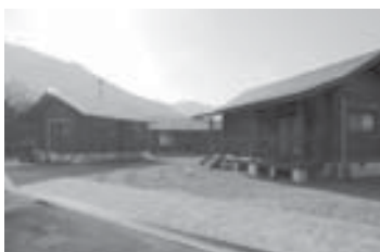
美濃田の淵公園周辺のバンガロー

施設（バンガロー、テニスコート等）の指定管理が、今年度末を以て3年間の契約が終了する。それに伴い、次期指定管理者を公募後、管理する能力等を総合的に判断した結果、合同会社「ななな」