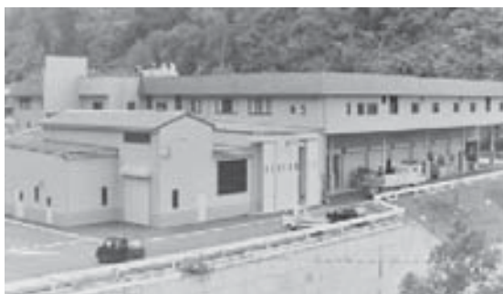
リサイクルセンター