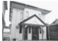
西庄コミュニティセンター

さらに、調理室の床の傷みを修繕する。工事費用の1割は地元負担で、工事請負費と工事監理委託料などで704万5000円。