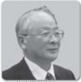
は せ が わ よ し ま さ 長谷川吉正議員