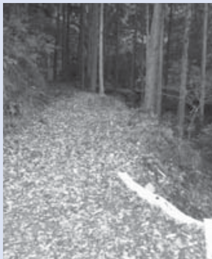
町道内野谷線改良起点

や予算等の関係から、今年度で一区切りする。本年度予定している内容は、山側法面に張コンクリート工法で施行し、谷川に大型ブロック積み等の施工等に35・5坪の改良工事に加え、500坪のアスファルト舗装を行う。