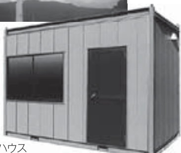
事務所にするプレハブハウス