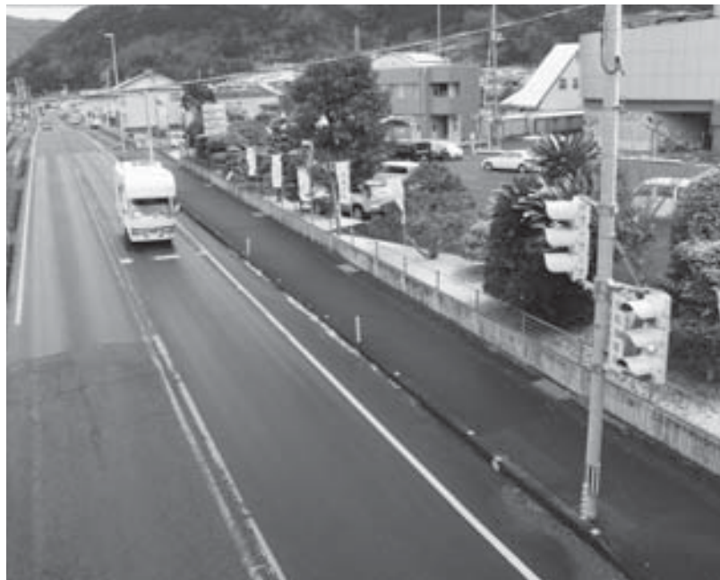
改良される交差点

ている。管轄する国土交通省では、交通の円滑化を図り、安全な交通環境を確保するために交差点改良を行うものである。今回の改良に伴い、庁舎の国道に面した北側の植え込みや駐車場の一部が当該改良予定地のため、敷地内の支障木の移転撤去を行うものである。移転撤去費270万円。