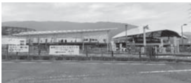
吉野川ハイウェイオアシス