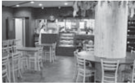
クル・クル店舗内