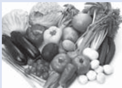
野菜も返礼品に加えては？

さと納税額が少ないのは返礼率が低いのが原因であると考えられる。社会的情勢を鑑み、新年度から返礼率を30%にするとも