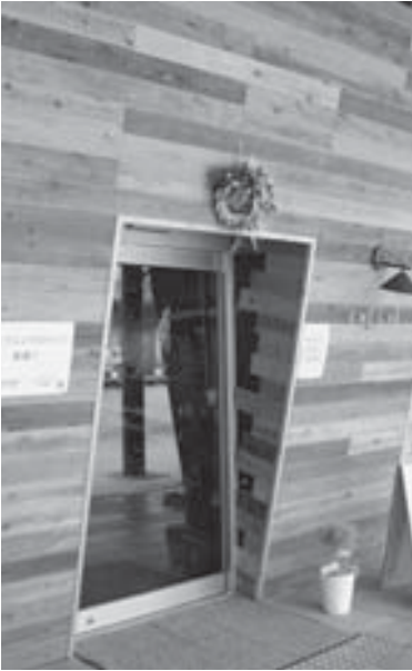
クル・クルの入口

主な質問として、オアシスへの店舗の出店については、カフェ「クル・クル」が12月10日からオープンし、成城石井コーナーが12月中