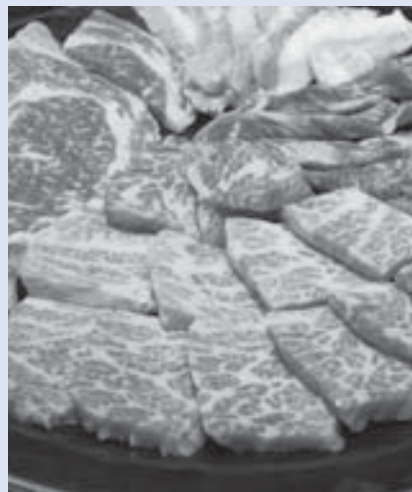
肉も返礼品に加えては？