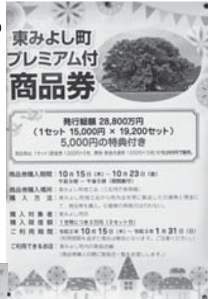
プレミアム付き商品券ポスター