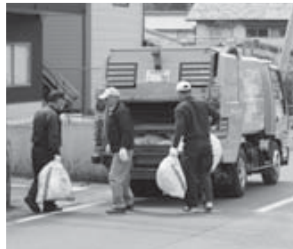
ごみの排出量の削減を

環境課長 令和元年の総排出量は4949トン、処理費用は1トン当たり4万5857円。町のごみの分別は6種類。資源物は6種類。令和元年度のリサイクル率は11.5%。今後、ごみの削減に取り組み、リサイクル率を向上し、有用な資源の循環を図りたい。清掃センターの用地は、概ね1.5ヘクタール。