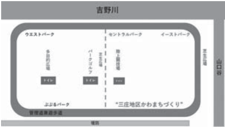
ぶぶるパーク提案図