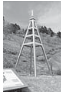
ゆめりあ34のモニユメント

を結ぶ「あいあい橋」を視察し、橋の架け替え方法などの説明を受けました。 庁舎に帰り、委員会室で各施設の管理の徹底や、公園の遊具の修理、定期的な点検をお願いして委員会を閉じました。