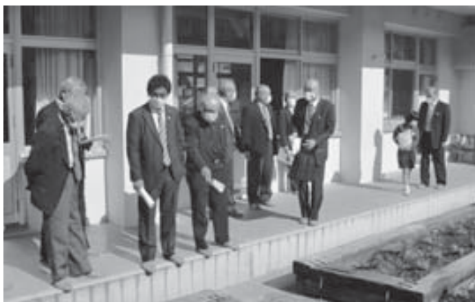
加茂小学校を視察する委員

最後に、委員会として児童生徒が安全で安心できる環境で学校生活を送れるよう、今後視察や意見交換をして町当局へ提言することを確認しました。