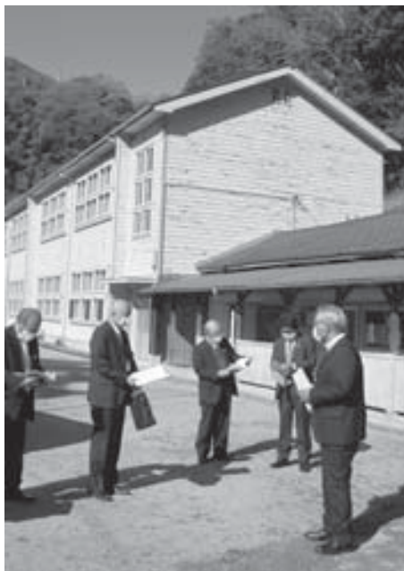
旧東山小学校で説明を受ける委員

昼間小学校の駐車場は手狭であるために、借地している188平方メートルの土地を職員及び来校者用に8台分の駐車場を整備していました。