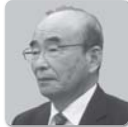
よしい たけし 吉井 武議員