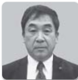
なかがわ ゆうじ 議員 中川 祐司