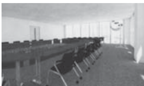
3階災害対策室イメージ図

は、①浸水に対応するため、北と南の1階出入口に高さ60センチの止水板を設置する。②分庁舎南側から東側の堤防に向かって車両が出入りできるようにし、緊急時等に使用する。③3階の秘書室を北側に140センチ広げた。④屋上のエレベーターは小型化が進んだため、3階の天井