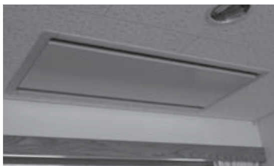
更新される空調設備

12月定例会は、12月8日から12月18日までの11日間の会期で開催しました。この定例会では、令和2年度一般会計補正予算・特別会計補正予算、条例改正などを審議し、いずれも原案の通り可決しました。 一般質問には8人の議員が登壇して、ふるさと納税の返礼品やオアシスの運営などについて活発な質問を展開し、町の考えをただしました。