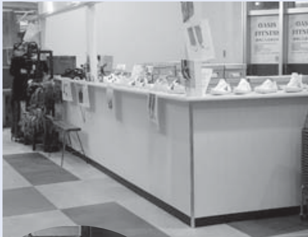
オアシス内の販売品

営業時間については、コロナ禍の状況でできる最大限のことと説明を受けた。※産直は、オアシスの一等地を借りて営業しているので、交流する機会があつていいのではないか。