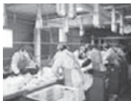
ゴミの選別 (リサイクルセンター)