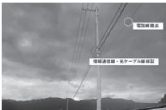
上方に移設する架線

また、大型重機や車両等の通行に支障が出ないよう電柱等の支障物件（情報通信線、光ケーブル線）を約1坪電柱の上方に移設する。