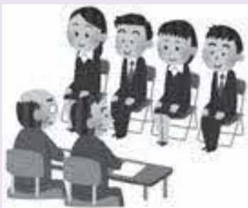
採用試験・面接 (イメージ図)

中で、様々なスキルを有した優秀な人材を確保しなければならぬという課題がある。その中で、上限年齢を引き上げ過ぎても、またそれによって起こる不具合等が生じる可能性もある。そういったところも見極めながら、採用年齢の範囲の拡大であるとか、他の自治体、企業などにある程度の年数以上を勤務した経験を持つ者、スキルを有する者を対象とした社会人枠といった特別枠なども検討の対象に入れながら、適正な上限年齢の設定を検討していきたい。