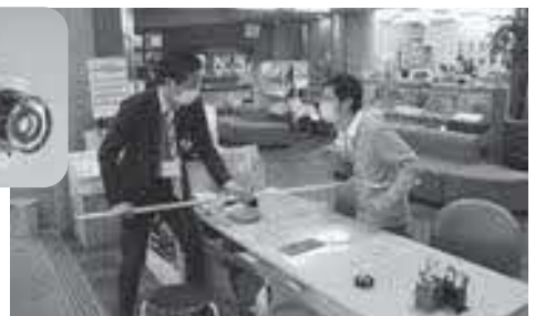
さすまたを使つての訓練