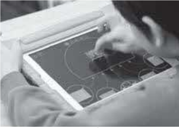
一人一人にタブレットを

児童生徒1人に1台の端末、および高速大容量の通信ネットワークを一体的に整備し、全国の学校現場で持続的に実現させる構想。