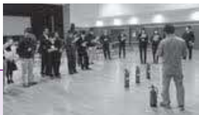
消火器を使っての訓練