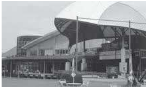
経営改善が急がれるオアシス

ついて詳細な説明を受けました。委員からは、今日まで複雑な事情の中で踏襲され、借地料が発生し有効活用がされていない土地については、返上等の適切な措置を講じる必要があるのではとの意見や、現在、整備が進められている水辺の楽校東側に高齢者や障害者の方にも配慮したトイレ等の整備が必要ではとの意見がありました。