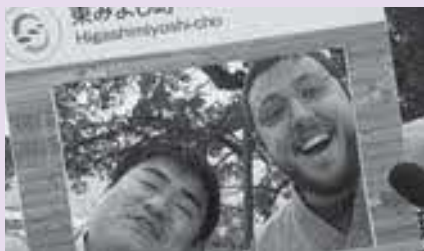
地域おこし協力隊員募集

地域外の 人材を積極 的に誘致し、地域力の 維持・強化の一環として、 新たに地域おこし協力 隊員を募集する。年々 増加している空き家等 の有効活用方策や所有 者等の適正な維持管理、 利活用への意識啓発、 移住・定住促進活動、 地域に関わりや関心を 持つ人々と言われる「関 係人口」に関する取り 組みや、SNS等を活用 した町の情報発信など に積極的に活動する隊 員1名(企画課所属)と、 世界農業遺産・歴史文 化遺産等を活用した旅 行業、民宿開業推進活 動などに取り組む隊員 1名(産業課所属)の 合計2名の採用を予定。 募集に際しては、本