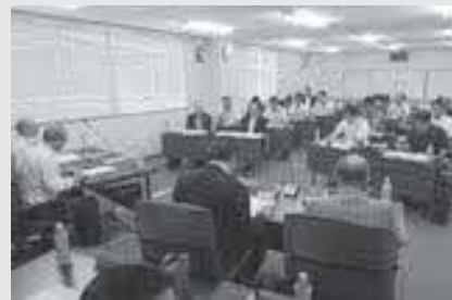
みよし広域連合議会

三好市と東みよし町で構成するみよし広域連合議会定例会が2月27日（木）に開催され、令和2年度の当初予算が決まった。一般会計の予算は24億2605万1千円となり、前年度と比べて5億8449万4千円の増となった。 歳出の主なものは、浄化センターの前処理・脱水機整備に係る工事費4億7561万円や旧池田消防署解体工事費4687万円、東消防署改修工事費5159万円。 また、介護保険特別会計予算は65億2457万3千円となり、前年度と比べて4億8214万9千円の増となった。三好地区広域振興整備事業は270万円。