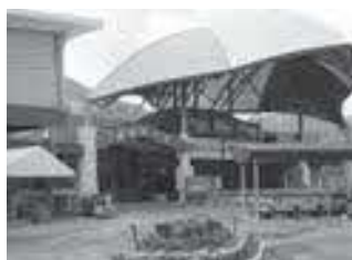
吉野川ハイウェイオアシス

新経営陣 で、経営改 善の計画書を作成し、 議会で承認をいただき、 金融機関へ借入申請を 行う。