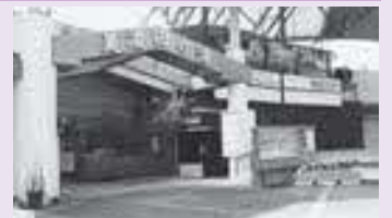
オアシスの美濃田の湯入口

職員の資質向上研修、また、その他の研修とのバランスも必要と考えている。それら研修について、新年度から長いスパンで考えながら実施をしていきたい。