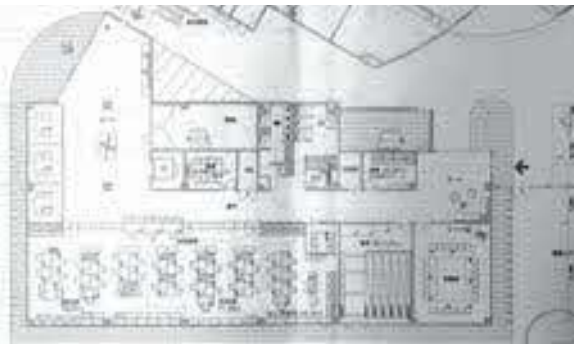
分庁舎1階平面図(案)

次に、職員による庁舎のセキュリティの最先端の手法についての視察が、1月30日に実施されましたので、その報告がされました。広島市にある熊平製作所は、セキュリティゲート、マイナンバーなど重要書類を収めた金庫の力ギの管理や、公用車の予約・鍵管理、電気錠を用いたオートロック等による入退出セキュリティ管理、監視カメラに録画監視等などの商材を幅広く取り扱っている会社であるとのこと。