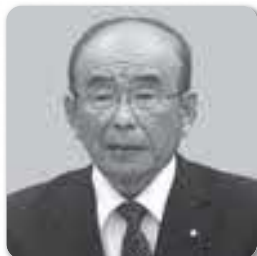
よしい たけし 吉井 武議員