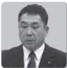
なかがわ ゆうじ 中川 祐司議員