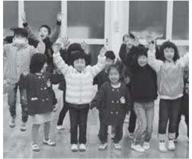
元気な子どもたち