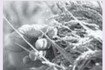
種子法廃止でどうなる

また、県に確認したところ、 廃止後、旧種子法に準拠した要 綱等をすでに制定しており、業 務体制に変わりなく、優良な種 子の安定供給に取り組んでおり ますとの回答であった。 町として独自の対策は、今の ところ考えていない。