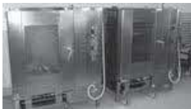
スチームコンベクション

※真空冷却機…調理済食品の温度を素早く下げる。細菌繁殖温度帯（50〜20℃）を無菌状態で通過させる事により、菌の繁殖を抑える機器。 ※スチームコンベクションオーブン…ファンにより熱風を強制対流させるオーブンに蒸気発生装置を取り付けて、「焼く」「蒸す」「煮る」「炊く」「炒める」などが出来る多機能な加熱機器。