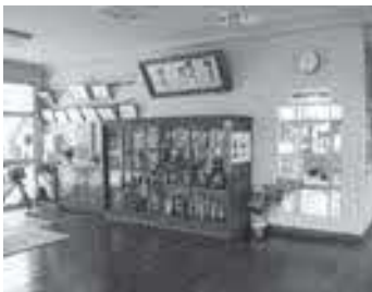
会議室に改修される場所

足代小学校には、 会議に使用できる部 屋が少なく、保護者との面談や 来客対応時にスペースを確保 するのに大変苦労をしている。 今回、職員玄関ホールの空きス ペースを利用して、約30平方 メートルの会議室を新設する。会議室新 設工事費380万円。 また、同校運動場のフェンス ネットは、長年の使用により穴 が開いたり、針金が飛び出して いる箇所もある。児童が触ると