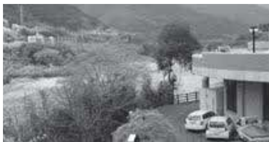
景観を損ねる樹木