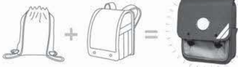
ナップサック+ランドセル=ナップブランド

プサックとランドセルの機能を備えたかばんということの名づけられ、北海道の小樽市で昭和45年頃から使われるようになった。ランドセルに比べると300グラムから500グラムほど軽く、7〜8千円から1万円くらいと安価で、求めやすい価格となっている。 一方、ランドセルは耐久性があり、背中がクッション性の高い素材でできており、体への負担が小さいことや、型崩れがないので収納している本やノートが傷みにくい特徴がある。特に、倒れたときにクッション代わりになるなどの特徴があり、実際交通事故で跳ね飛ばされた子供が、ランドセルがクッション代わりになり助かった例もある。このように、ランドセルもナップブランド等もそれ