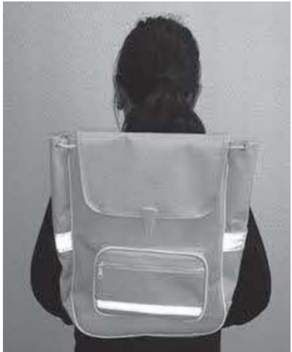
軽い安い丈夫なナップブランド

プサックとランドセルの機能を備えたかばんということの名づけられ、北海道の小樽市で昭和45年頃から使われるようになった。ランドセルに比べると300グラムから500グラムほど軽く、7〜8千円から1万円くらいと安価で、求めやすい価格となっている。 一方、ランドセルは耐久性があり、背中がクッション性の高い素材でできており、体への負担が小さいことや、型崩れがないので収納している本やノートが傷みにくい特徴がある。特に、倒れたときにクッション代わりになるなどの特徴があり、実際交通事故で跳ね飛ばされた子供が、ランドセルがクッション代わりになり助かった例もある。このように、ランドセルもナップブランド等もそれ