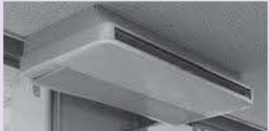
交換されるエアコン

三庄小学 校職員室の エアコンは、設置から 長期間経過し老朽化し ている。冷房の効きが 悪く、稼働時には過大 な電力を消費している。 また、職員室の階下