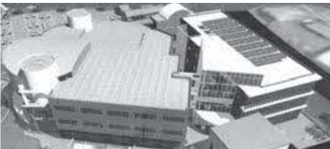
庁舎増築俯瞰図（南から見て）

最後に、委員の中から「現在、三加茂庁増築に関する請願書が出されており、建築費用が10億かかる」といわれているが、実際に分庁舎の建設費用はどのくらいで、どの財源を使い、町の持ち出しはどのくらいなのか」との質問が出され、「調査費用や土地購入費等は別で、実際の建設費用は約6億4千万円で、合併特例債を充当し、町の持ち出しは2億1千万円である」とのことです。以上が、今回の主な審査内容です。理事者には、十分に検討していただき、12月の委員会でも報告された「基本実施設計を6月までに終え、来年度中に発注。令和3年度下旬には竣工予定」を念頭に、スピード感をもって分庁舎建設に取り組んでいただきたいと要望しました。