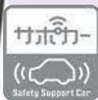
サポカー補助金の推奨マーク