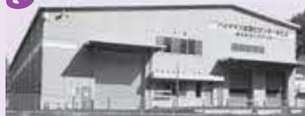
バイオマス資源化センターみとよ