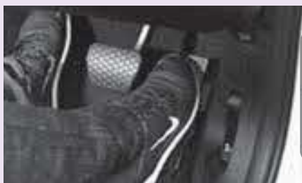
アクセルの踏み間違いをサポート

ではないので、管轄官庁であるとか県に問い合わせていただくことになるが、町の広報誌やホームページを通じて周知したいと考えている。