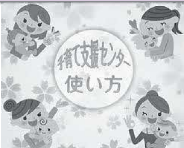
子育て支援としての使い方パンフレット(例)