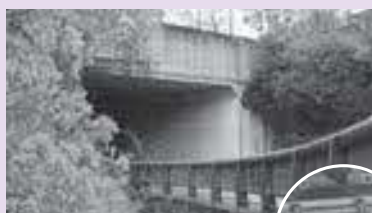
カルートボックスの入口

スエリアを通りオアシス駐車場に下りてくる。今回、西日本高速道路株式会社との管理協定に基づき、オアシス北側の上り車線側のサービスイリアとの連絡道路（カルートボックス内）の老朽化している道路照明灯を交換する。長寿命化を