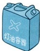
灯油などのポリ容器