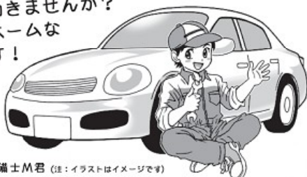
イケメン整備士M君 (注：イラストはイメージです)

自動車整備士を募集しています！ OASにて、整備・点検・車検等 できる方求む！お電話ください！