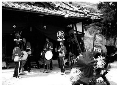
馬岡神社の獅子舞