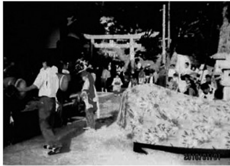
山祇神社の獅子舞

過疎により、昭和五〇年休止、平成二〇年保存会を結成し、復活する。町内の神社、小社の秋の祭礼で奉納する。