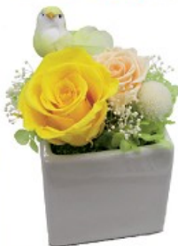
会員が作った プリザーブドフラワー

交流会に参加すると、どのような人が預かってくれるのか、どのような子を預かるのかなどが良く分かり、サポートのイメージが湧きやすくなります。今後も交流会を通して、会員同士の信頼関係を築き、預ける側・預かる側、双方の不安を少しでも解消し、安心・安全なサポートにつなげていきたいと思ひます。