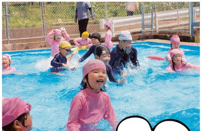
昼間幼稚園 プールあそび

＝ 町の人口 ＝ (平成 25 年 7 月 1 日現在) 男 7,296 人(+ 6) 人口 15,431 人(+ 3) 女 8,135 人(- 3) 世帯数 6,224 (+ 5)