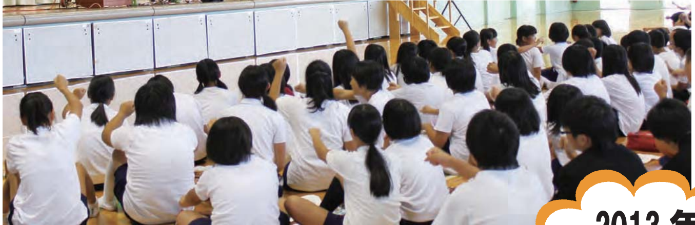
青少年育成・人権啓発トーク&コンサート（詳細は2ページ）