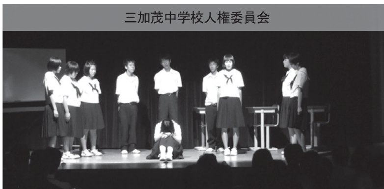
三加茂中学校人権委員会