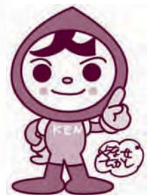
人権イメージキャラクター 人 KEN まもる君