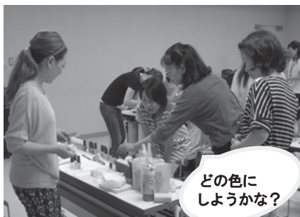
どの色にしようかな?