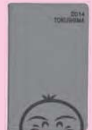
▲すだちくん版 【ナイルグリーン色】