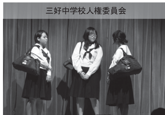
三好中学校人権委員会