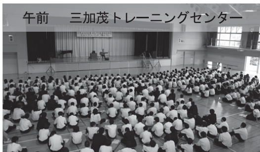
午前 三加茂トレーニングセンター