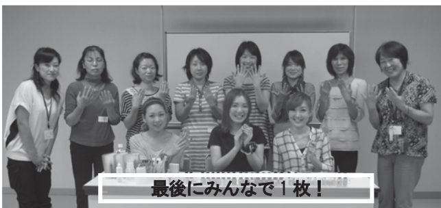
最後にみんなで1枚!

交流会に参加すると、どのような人が預かってくれるのか、どのような子を預かるのかなどが良く分かり、サポートのイメージが湧きやすくなります。今後も交流会を通して、会員同士の信頼関係を築き、預ける側・預かる側、双方の不安を少しでも解消し、安心・安全なサポートにつなげていきたいと思えます。