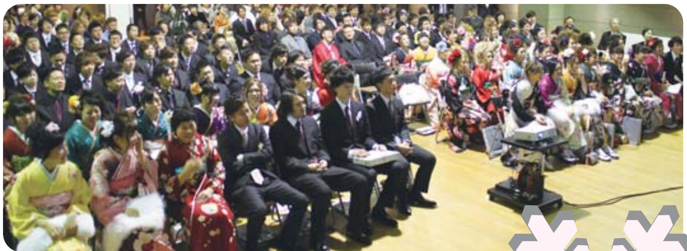
東みよし町成人式（詳細は2～3ページ）

＝ 町の人口 ＝ (平成26年1月1日現在) 男 7,273人(+12) 人口 15,339人(+5) 女 8,066人(-7) 世帯数 6,219 (-6) ＝ 町の面積 ＝ 122.55km 2