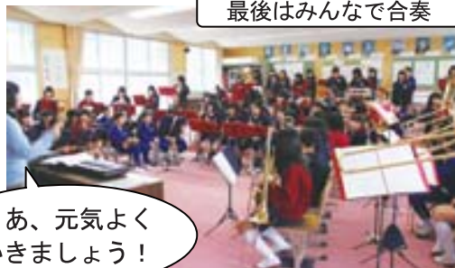
最後はみんなで合奏