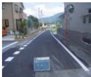
施工後(町道光下馬木谷線)

この事業は、発電用施設の設置に係る地元の理解促進等を図ることを目的としています。水力発電用施設等の所在する市町村およびその周辺市町村が、公共用施設の整備や住民福祉の向上のために行う事業に対して交付金を交付しています。