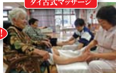
タイ古式マッサージ

下肢のマッサージで、血液とリンパ液の循環を促し、根本的な体質の改善を目指します。