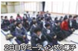
2回目のミーティングの様子