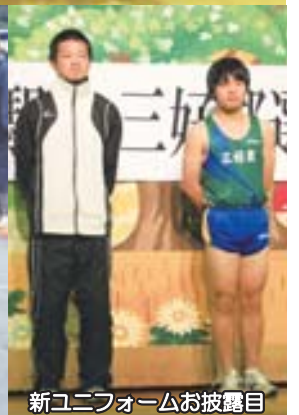
新ユニフォームお披露目