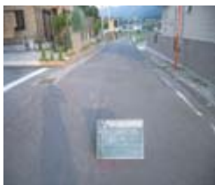
施工前(町道光下馬木谷線)

平成25年度、電源立地地域対策交付金事業を活用し、町道光下馬木谷線の舗装を行いました。三好中学校への通学路でもある当路線は、老朽化により路面が傷んでいました。そのため、この事業を活用して道路を舗装したことにより、路面が平坦になり、通学者・通行者の安全が確保されました。