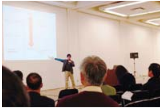
生活困窮者の社会的排除についての講習

平成26年2月6日、7日の2日間、三重県津市の「三重県総合文化センター」と「四日市市文化会館」において第28回人権啓発研究集会が開催されました。東みよし町から福祉課職員が参加しています。2カ所あわせて2日間延べ8000人を越える方が参加し、人権・同和問題についての学習を行いました。