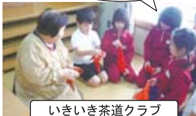
いきいき茶道クラブ