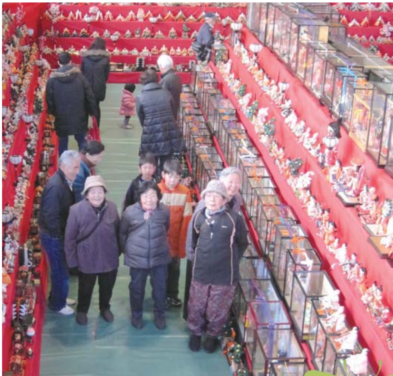
しま 東山の節句まつり（開催期間 2月23日～3月9日）

＝ 町の人口 ＝ (平成26年2月1日現在) 男 7,274人(+ 1) 人口 15,344人(+ 5) 女 8,070人(+ 4) 世帯数 6,231 (+12) ＝ 町の面積 ＝ 122.55km 2