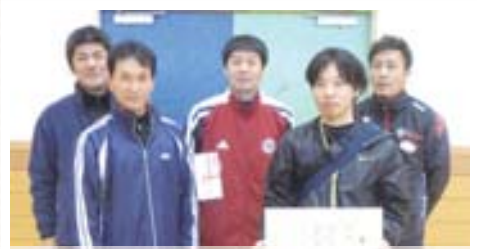
▲地区対抗 男子の部 優勝 10区