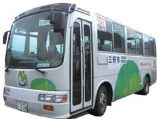
▲三好市営バスの車両

三好市三野町と同市池田町の間を運行している三好市営バス(三野池田線)は、県道鳴門池田線を走行していますが、本年4月1日から本町三好地区内においてもご利用いただけます。