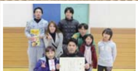
▲オープン 男子の部 優勝 球舞