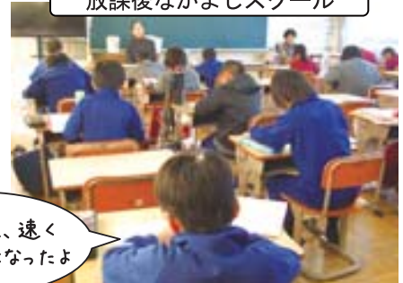
放課後なかよしスクール