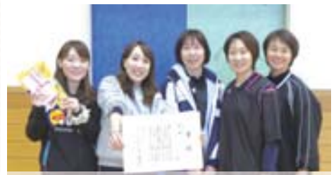
▲地区対抗 女子の部 優勝 13区