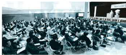
約 200 人も、ご来場をいただきました。

1月15日(日)、東みよし町役場三加茂庁舎ふれあいプラザホールにおきまして『消費者教育啓発講演会』を開催致しました。女流講師「神田紅」先生に、『度胸をつけて賢い消費者』と銘打ち、明るく楽しい講演を行っていただきました。