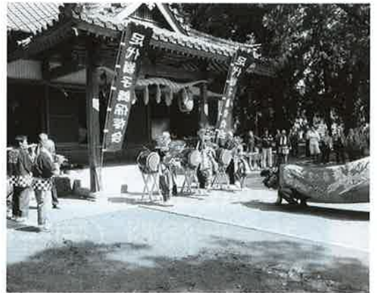
奉納舞（足代八幡神社）