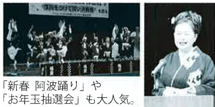
「新春 阿波踊り」や「お年玉抽選会」も大人気。