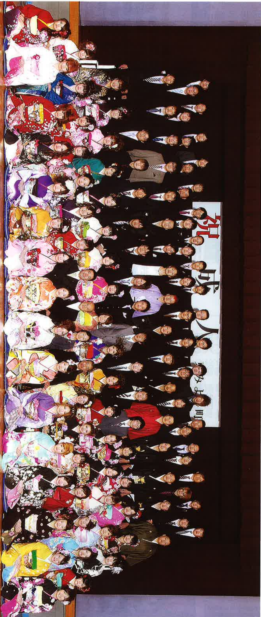
三加茂地区 男 77人 女 60人 計 137人 (該当者数)