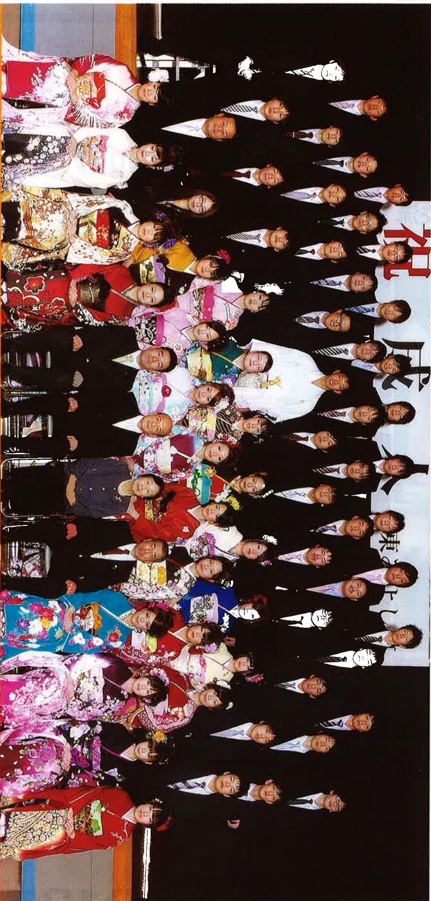
三好地区 男 42人 女 28人 計 70人 (該当者数)