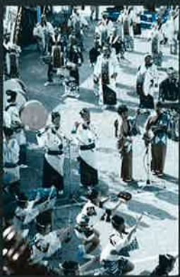
オアシス合同連公演風景

独特に変化し、生まれた『阿波よしこの節』。はじめ、三味線は本調子で踊りもゆつくりしておりましたが、明治から大正にかけて、三丁調子になって急調子となり、そめきの踊りも速く現在のようになりました。疾走するはざれ良いそめき、にし阿波の特徴でもあります。