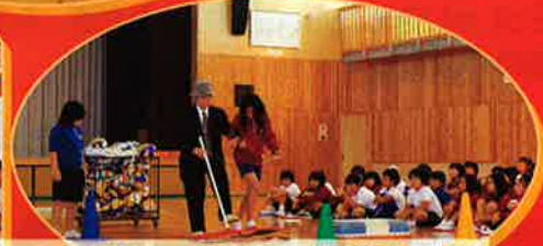
アイマスクをして、杖を持って歩行練習(加茂小学校)