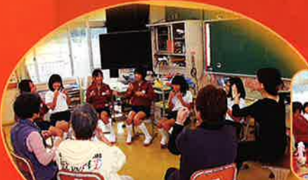
手話サークルの人達と手話の練習(三庄小学校)

障がい者の姿を知り、学校、地域で障がい者理解をひろげ、無知による差別をなくしましょう。