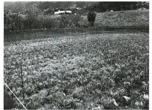
防鳥ネットで対策