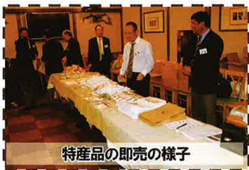
特産品の即売の様子

会場では、東みよし町商工会による特産品の即売も行われました。餅や愛宕柿、生うどんなど、ふるさとの商品は大人気で、用意した商品の大半を購入いただき、中には完売した商品もありました。