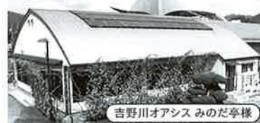
吉野川オアシス みのだ亭様