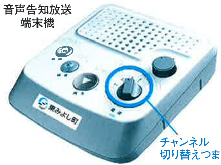
チャンネル 切り替えつまみ

3CH : NHK第一放送 4CH : NHK-FM放送 通常は1にしておいてください