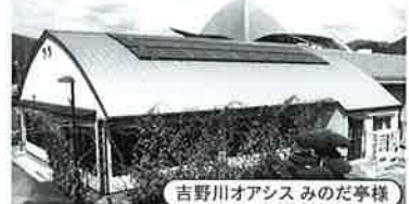
吉野川オアシス みのだ亭様