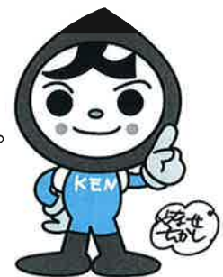
人権イメージキャラクター 人 KEN まもる君