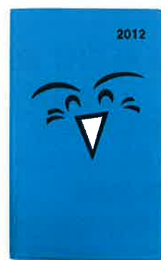
▲徳島県章版 【ニューグレー】