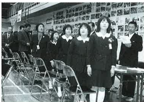
▲参加者全員で校歌を斉唱

その様な歴史と伝統のある学校も、平成22年度卒業生1人を送り出した後、在校生児童が3人となるため、関係者が協議した結果、休校することとなりました。