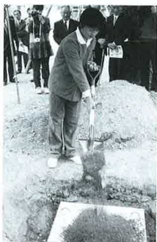
▶タイムカプセルの埋蔵

昭和14年に創立60周年記念事業、同55年には創立100周年事業が実施されるなど、130年余りにわたり伝統が受け継がれてきました。