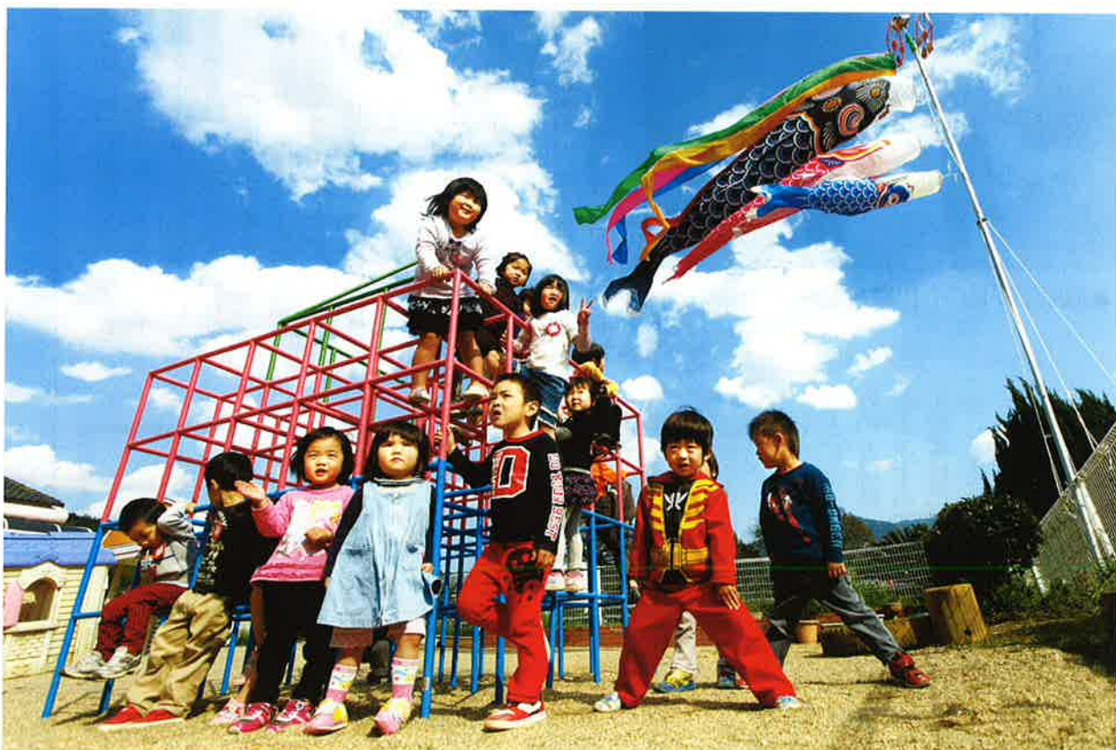
みよし保育所の園児と鯉のぼり