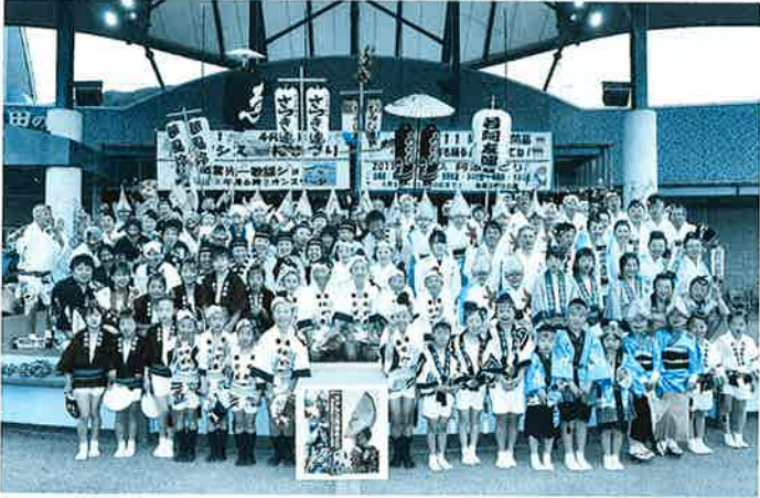
当日出演した合同連員 ※写真は1部のメンバーです。

みのだ連(東みよし)・若阿友連(東みよし)・さつき連(池田)・多びす連(池田)・夢風鈴(池田)・もみじ連(三野)の構成による、オアシス6連合同連、総勢約200名にてこの開幕ステージを飾りました。