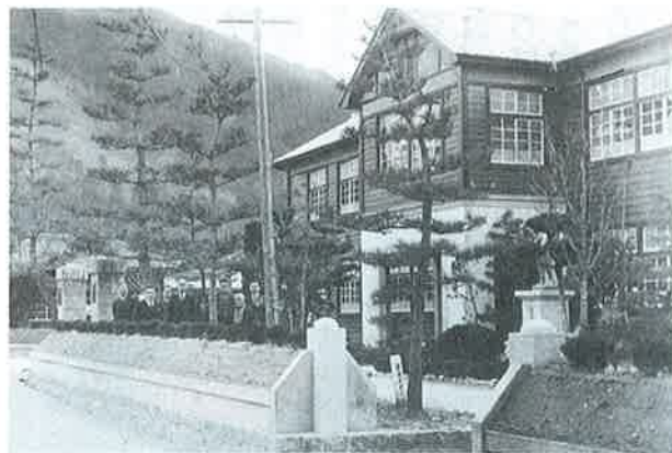
▲加茂小本館新築(昭和13年)袖垣が映える

その金で造られた袖垣は、八十数年の風雪に耐え、今も堅牢で美しい。校門を入って両側には、大学卒業を記念して植えられた。「大学松」九本がそびえ立ち児童に青雲の志を：