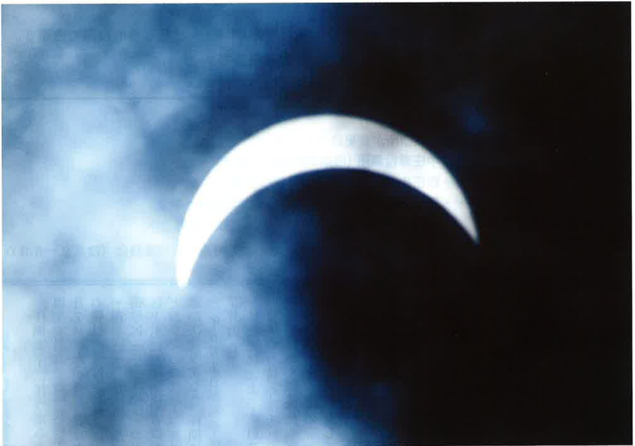
東みよし町での部分日食