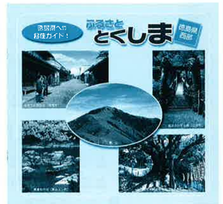
▲「移住ガイド」パンフレット