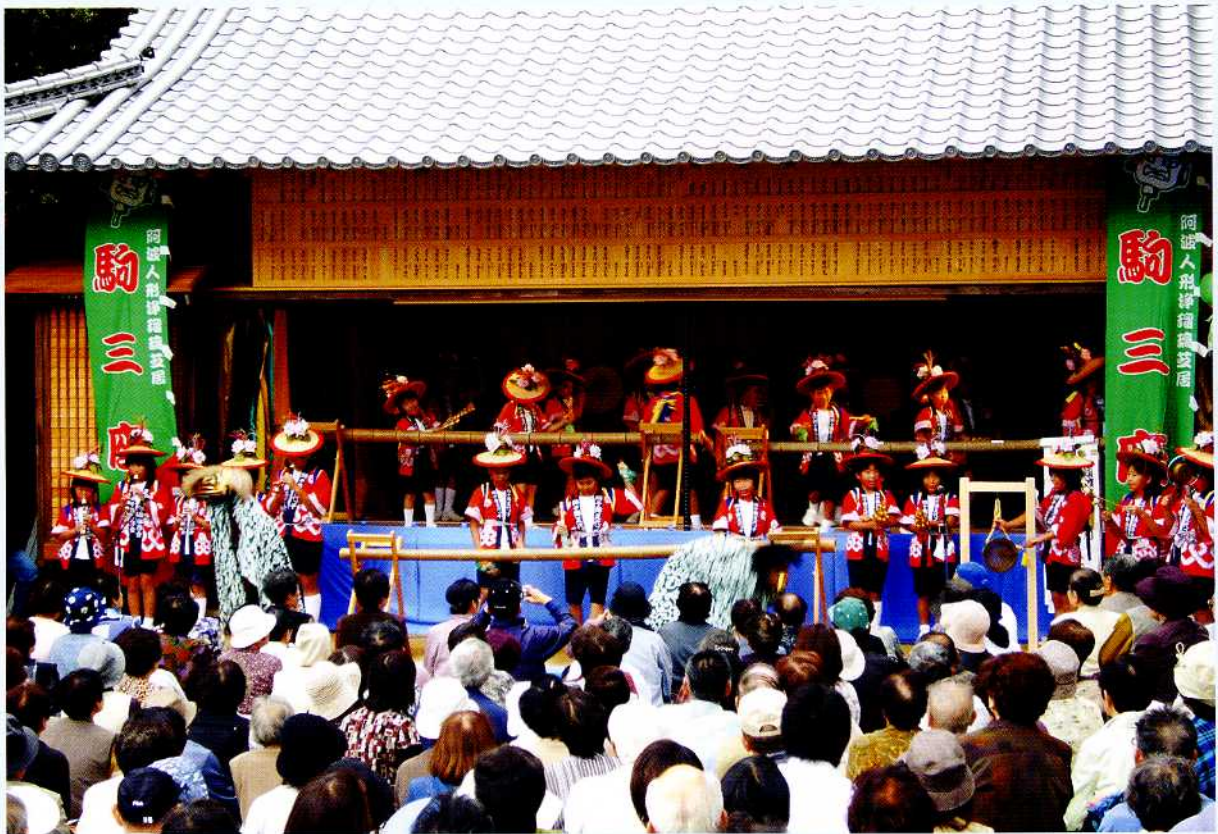
足代小学校児童による獅子舞公演(法市農村舞台)