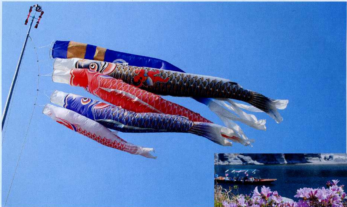
風に泳ぐ鯉のぼりと美濃田の洲の岩ツツジ