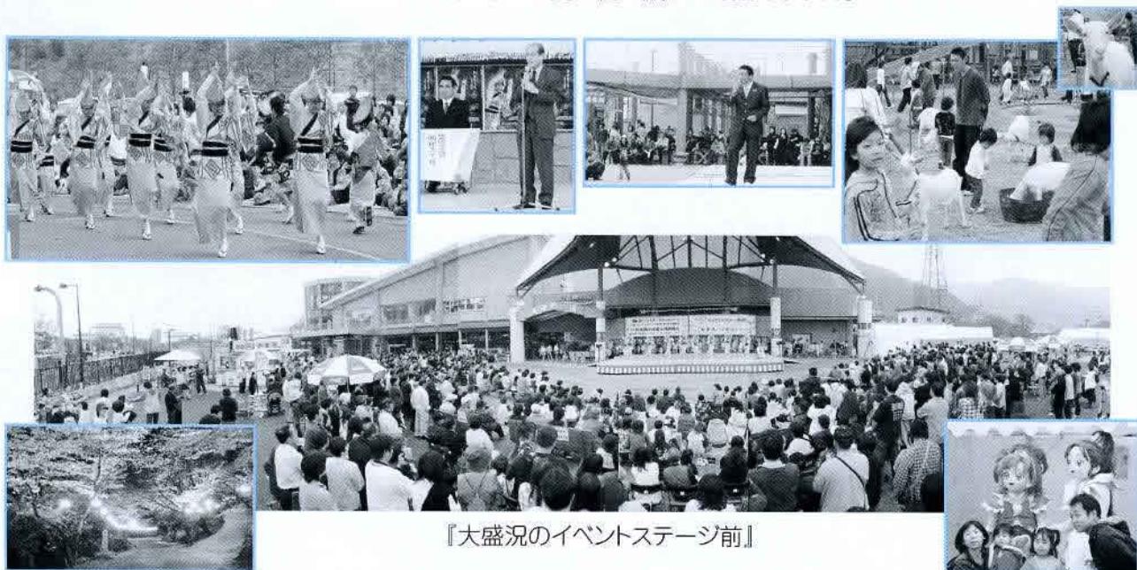
『大盛況のイベントステージ前』

平成19年4月1日に吉野川ハイウェイオアシスイVENT広場にて、当イベントを開催致しました。『桜満開』で彩られた美濃田の淵周辺は、来訪された多くの人々を魅了し、オアシスには1日で、町内外『11,000人』を越えるお客様にご来場いただき、近年希に見る程の賑わいを見せました。